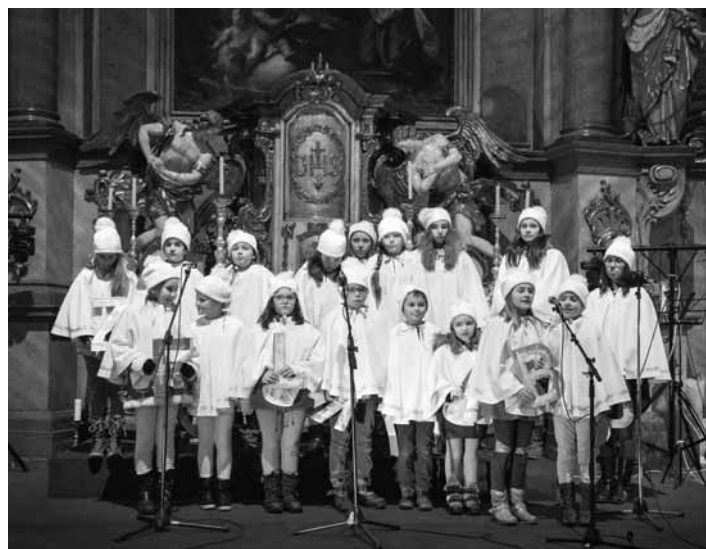
Žiaci ZUŠ sa predstavili spevom a tancom