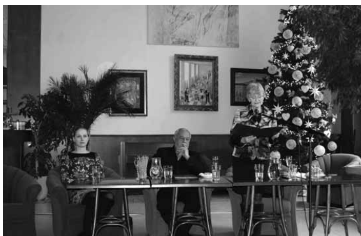
Predstavitelia samosprávy mesta

pomerne dobrý. V príjmovej časti rozpočtu sme zaznamenali nárast v plne-