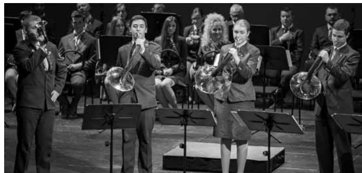
Trubači z lesníckych škôl