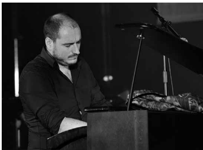
Klavírny virtuóz v Kultúrnom centre