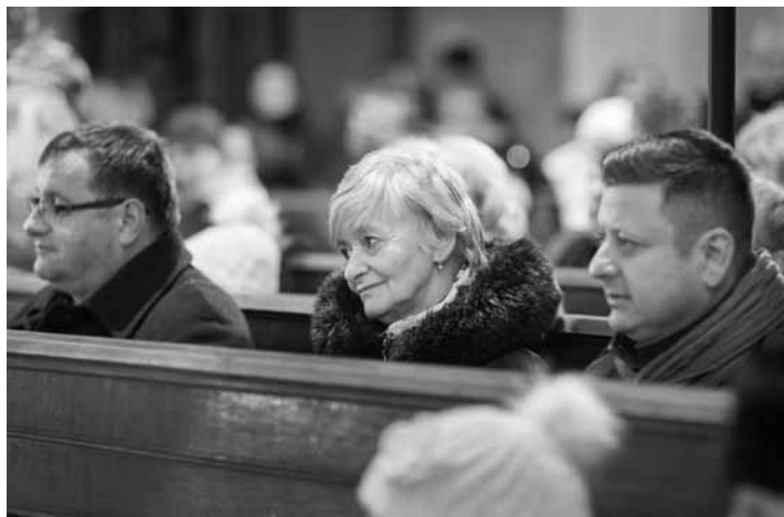
Pozvaní hostia na vianočnom koncerte