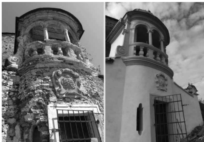
Pred a po rekonštrukcii kaplnky Ecce Homo