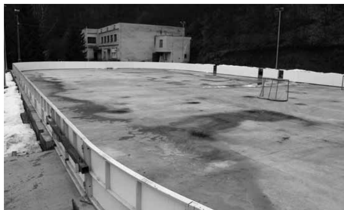
Vybudované športové ihrisko na Štefultove

striedkov boli na ihrisku Štefultov vykonané práce, ktoré boli realizované členmi a priaznivcami OZ ŠK Štefultov.