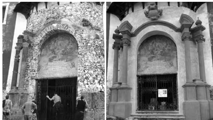
Pred a po rekonštrukcii portálu Horného kostola