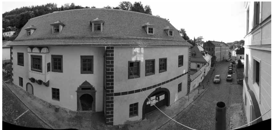
Baumgartnerov dom po rekonštrukcii (2021)