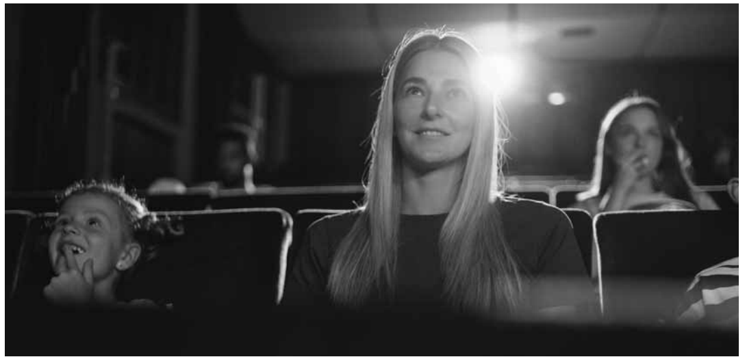
Príďte aj Vy do kina!