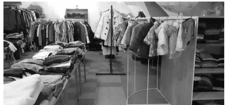
Výmenník v kultúrnom centre

Veci pre všetkých, bábätká, deti, mládež, dospelých aj seniorov. Ob-