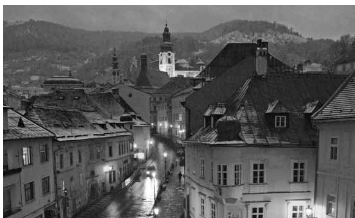
Večerná panoráma mesta

máme za sebou rok 2021, ktorý bol mimoriadne náročný. Všetci sme dúfali, že sa v ňom dočkáme konca pandémie a postupného uvoľňovania opatrení a postupnému návratu k životu, na ktorý sme boli zvyknutí. Žiaľ, realita bola iná. Aj rok 2021 bol poznačený množstvom obmedzení, s ktorými sme sa museli všetci vysporiadať. Obzvlášť citlivo dopadla kríza na odvetvia, ktoré tvoria dôležitú časť života nášho mesta – cestovný ruch a kultúru.