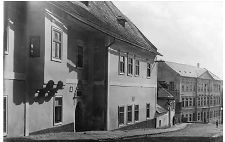
Baumgartnerov dom v r.1925