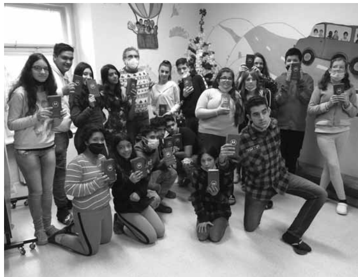
Obdarované deti ŠZŠ v Banskej Štiavnici

Piatkový predvianočný, a zároveň posledný deň v škole pred Vianocami bol už druhýkrát troška iný, ako po minulé roky, pretože pandemická situácia nám nedovolila zrealizovať celoškolské posedenie, ktoré sa u nás za bežných okolností realizuje pri spoločnom obede všetkých žiakov a zamestnancov (sme malá škola, preto sa v nej všetci cítíme ako jedna rodina) s klasickými tradíciami – tradíciami Banskoštiavničianov. Každá trieda si komorne zrealizovala úvod a keďže nedočakavosť bola veľmi silná a intenzívna, tak cca okolo pol desiatej dopoludnia si druhostupňoví žiaci našli pod školským stromčekom svoj vytúžený darček. Škoda, že ste pri tom neboli, pretože vidieť tak spontánnu radosť detí, z ktorých možno (matematicky vzaté) väčšia polovica nikdy vianočný darček nedosta-