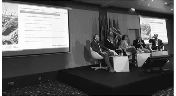
Konferencia v portugalskom Lisabone

Konferencia sa týkala uzavretia programov a vyhodnotenia projektov financovaných EEA grantmi ohľadom klimatických zmien vo svete. Základná škola na Štiavnických Baniach bola vybratá ako zástupca Modrých škôl na Slovensku, ktoré EEA granty využili na skvalitnenie životného prostredia, v ktorých sa školy nachádzajú, a na zvýšenie povedomia o klimatických zmenách, ktorých sme všetci súčasťou. Spolu s predstaviteľmi por-