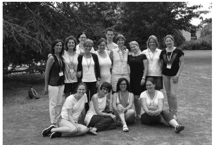
Pedagógovia na vzdelávacom kurze

štúdiu na našej škole. Okrem nadobudnutia nových odborných poznatkov sme sa zároveň oboznámili a inšpirovali s formou výučby na školách v zahraničí obdobného typu a vytvorili partnerské vzťahy prostredníctvom zúčastnených