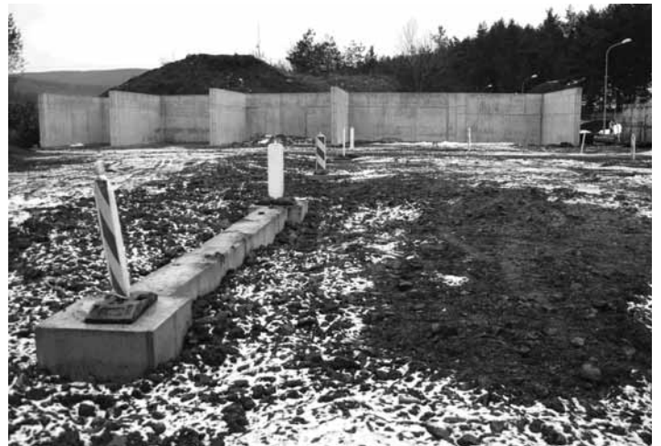
Základové pätky haly kompostárne, v pozadí vybetónované skladové boxy na bioodpad a kompost

Momentálne (3. januárový týždeň) stavenisko opäť oživa – montuje sa oceľová hala, ktorá tvorí technologické jadro kompostárne. V hale bude technológia na prípravu vstupnej suroviny do fermentora vrátane drviča kuchynského bio-