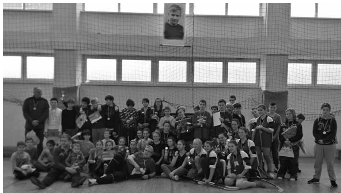
Účastníci florbalového turnaja o putovný pohár