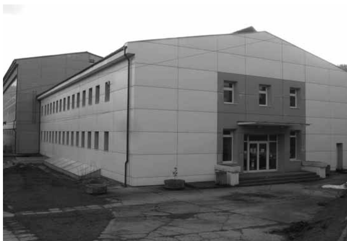
Mestská plaváreň na Mládežníckej ulici

Okrem plávania v bazéne sa môžete zrelaxovať v priestoroch sauny (suchá, parná) s ochladzovacím bazénom a odpočívárňou. Plaváreň vám okrem týchto služieb ponúka ďalšie možnosti relaxu a športového využitia, ako sú aj profesionálne masáže služby a posilňovňa. Príďte, urobte niečo pre svoje zdravie a dostaňte sa do životnej formy! Plaváreň sa nachádza na Mládežníckej ul. v Banskej Štiavnici a je otvorená UT: 11:00 – 20:30 hod., ST – PI: 13:00 – 20:30 hod., SO-NE: 14:00 – 20:00 hod. V pondelok je sanitárny deň a plaváreň je pre verejnosť uzatvorená. K dispozícii je