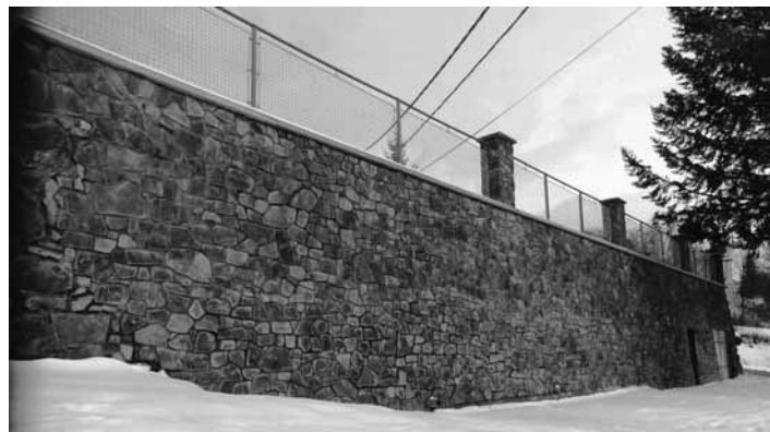
Nový oporný múr pri materskej škole