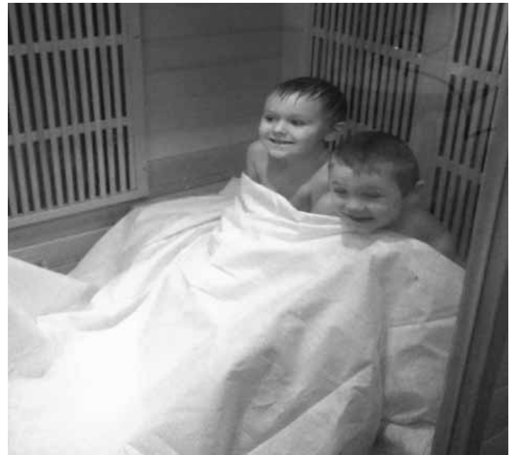
Otužovanie a posilňovanie imunity detí MŠ

Sauna má blahodárne účinky na naše zdravie a je výborná ako prevencia proti rôznym chorobám a zvyšuje odolnosť organizmu. Potením sa z tela vyplavujú všetky toxíny a následné ochladzovanie zvyšuje naše otužovanie. Uvoľňuje telo i dušu, nervové napätie, pri naša psychickú i fyzickú relaxáciu a prispieva k zhromažďovaniu síl. Len sauna dokáže uviesť telo i dušu do takého harmonického a rovnovážneho stavu. Kto už zažil tieto pocity v saune, isto toto všetko potvrdí.