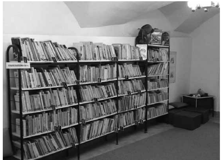
Z knižného fondu v mestskej knižnici