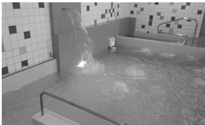
Vírivá vana s masážnymi prvkami

Vo vírivke vane je osadených 8 miest s masážnymi prvkami s predvzdušňovaním, štyri dnové chlčiče vody a jeden chrlič vody na masáž chrbta.