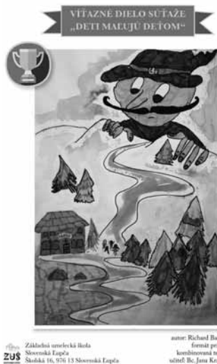
Základná umelecká škola Slovenská Ľupča, Školská 16, 976 13 Slovenská Ľupča autor: Richard Bačk, v.č. formát práce: A4 kombinovaná technika súťaž: Jc. Jana Krájanová