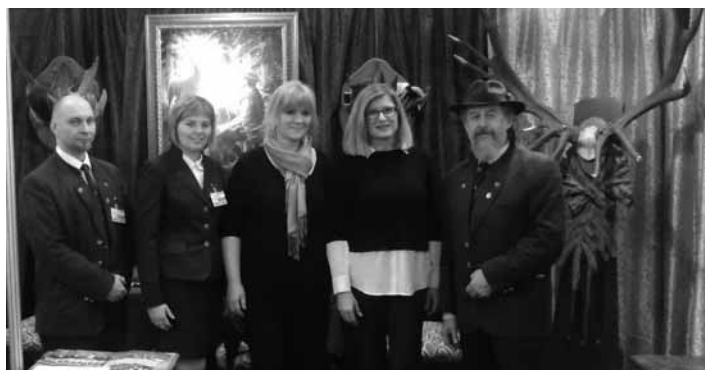
Ministerka PRV SR s pracovníkmi múzea

Múzeum vo Svätom Antone sa na tejto výstave zúčastňuje od 1. ročníka, ktorý sa konal ešte v areáli PKO. Na tohtoročnom jubilejnom – 25. ročníku, sme sa prezentovali opäť spoločne so Strednou odbornou školou lesníckou z Banskej Štiavnice, ktorá na výstave taktiež tradične nikdy nechýba. Študenti i pedagógovia SOŠL tohto roku prezentovali hlavne sokoliarstvo a lesníčiarstvo. Okrem zaujímavých expozícií, ktoré upútali všetkých návštevníkov veľtrhu, sme predstavili činnosť Múzea vo Svätom Antone i SOŠL v Banskej Štiavnici taktiež na pódii v pavilóne haly B2. Súčasťou programu bolo aj pozvanie na dve výnimočné polovnícke podujatia, ktoré sa na Slovensku uskutočnia v septembri: 1. septembra 2018 to bude jubilejný 20. ročník Majstrovstiev Európy vo vábe-