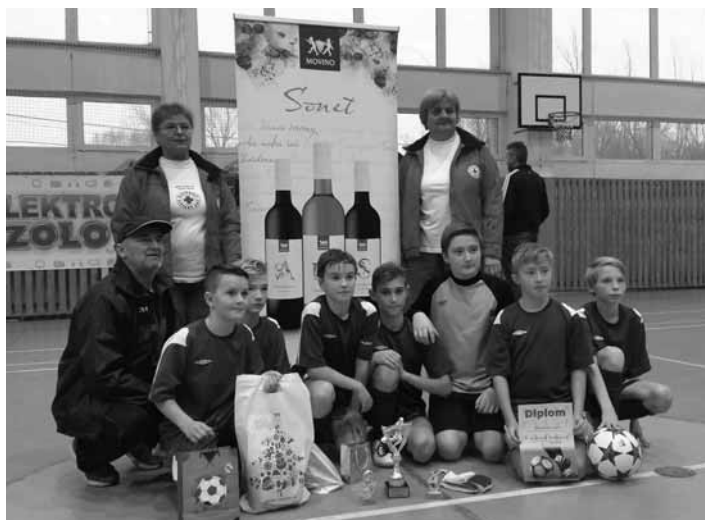
Nádeje FK Sitno Banská Štiavnica