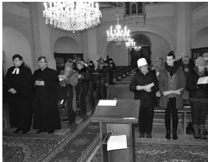
Modlitby v evanjelickom chráme