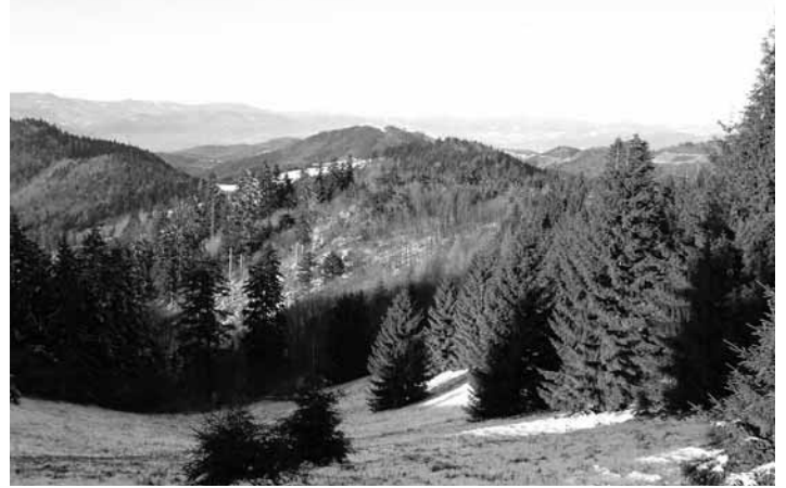
Pohľad na panorámu lesa

trebné ťažbu realizovať alebo stav následného porastu nedovoľoval ťažbu. V oblasti ťažby sme splnili 10-ročné úlohy dobre a ušetrenú ťažbu budeme rúbať v nasledujúcom období. Plán zalesňovania lesa sme tiež splnili. Obnova lesa je nastavená tak, že porasty rúbeme takým spôsobom, aby sa les obnovil prirodzenou cestou. Takto vytvárame les zo stanovištné domácich drevín a náklady spojené so zalesňovaním minimalizujeme na maximálne možnú mieru. Umelé zalesňovanie robíme len na pozemkoch, ktoré sú buď nezalesnené prirodzenou cestou, alebo je tam zlé stanovište, ktoré spôsobuje to, že sa prirodzený les nedostaví sám a je potrebný zásah človeka. Z ďalších úloh to bola výchova mladších štádií lesa cestou prerezávok. Tie sme vykonali na ploche cca 516 ha. Je dobré, ak sa do mladých porastov zasahuje a upravuje sa nielen ich drevinová skladba a hustota, ale sa aj odstraňujú poškodené stromy. Takto sa mladé lesné porasty v nasledujúcom období môžu priaznivo vyvíjať. V starších vývojových štádiách lesných porastov sme zásahy vykonali do tej miery, ktorá bola potrebná. Pri tom bolo potrebné zohľadniť aj vplyv kalamít, ktorých našťastie nebolo veľa. Kalamitné ťažby boli len na úrovni 13 000m 3 , čiže za tých 10 rokov to vychádza cca 1 300m 3 kalamitného dreva. To v niektorých lesných porastoch spôsobilo, že sme výchovné zásahy nemuseli robiť alebo sme ich odložili, nakoľ-