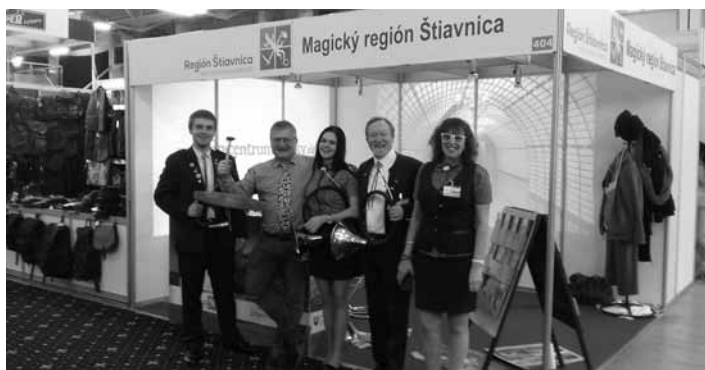
Stánok OOCR Región Banská Štiavnica

Tento veľtrh cestovného ruchu patrí medzi najvýznamnejšie veľtrhy CR v regióne strednej Európy. Každoročne prináša rozmanitú ponuku pre ľudí, ktorí majú záujem spoznávať krásy Slovenska alebo navštíviť zahraničné destinácie. Prezentujú sa tu združenia, cestovné kancelárie, kúpele, hotely, regióny Slovenska, Čiech, Maďarska, Rakúska, ako aj iné krajiny sveta, lákajúce potenciálnych návštevníkov. Banská Štiavnica sa na ITF Slovakiatour prezentuje každoročne a tento rok sa ako spoluúčastník zúčastnilo aj „ Epicentrum lásky – Dom Maríny “, ktoré upútalo návštevníkov svojou netradične poňatou expozíciou. Mesto a región sa tento rok prezentovali pod hlavičkou OOCR Región Banská Štiavnica