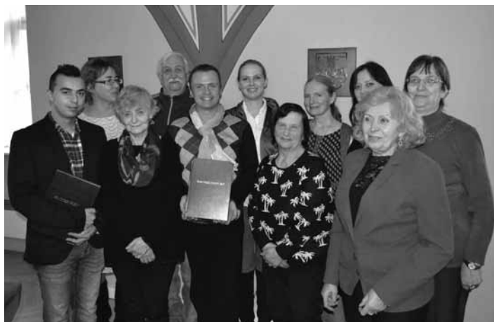
Tvorcovia mestských novín