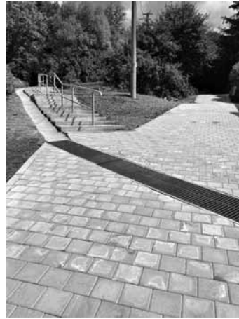
Chodník Ul. Fándlyho

Primátorka mesta v roku 2021 rokovala s predsedom vlády, viacerými ministrami, poslancami Európskeho parlamentu, poslancami NR SR a predstaviteľmi rôznych inštitúcií a firiem. Banskú Štiavnicu aj