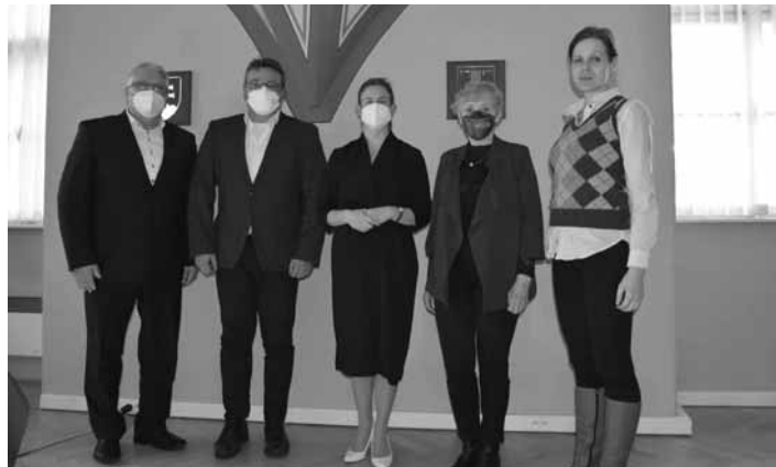
Delegácia v zasadačke na radnici

Dňa 3.2.2022 sa na radnici uskutočnilo ďalšie rokovanie s ministerkou kultúry SR Natáliou Milanovou, po dohode primátorky mesta Banská Štiavnica a ministerky kultúry SR, za prítomnosti primátorov miest Banská Štiavnica, Bardejov, Levoča a Spišské Podhradie.