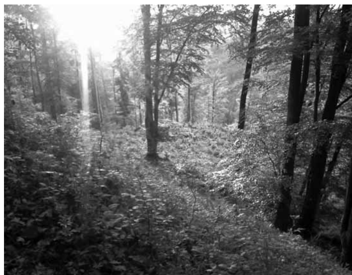
Panoráma lesa

Dobrym obrazom toho, ako sa správať k lesu a prírode sú kalamity, ktoré prebehli vo Vysokých a Nizkých Tatrách.