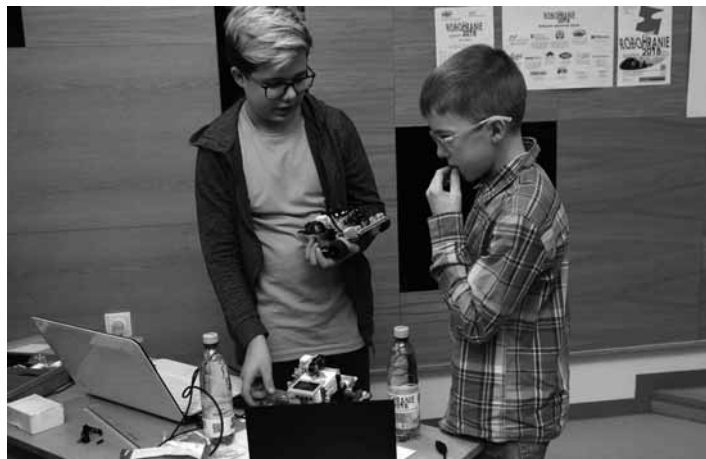
Súťažiaci pri posledných úpravách robota

V utorok 6.2. predstavovali tímy zo základných škôl svojich robotov na tému „Stroje a zariadenia“, pričom ich hodnotila odborná porota z hľadiska originality, funkčnosti a náročnosti. Inšpirácie súťažiacich boli rôzne: triedenie a počítanie výrobkov podľa farby, automatizované závory, automat na cukríky, sonda skúmajúca iné planéty, robotizovaný poštár, zametajú-