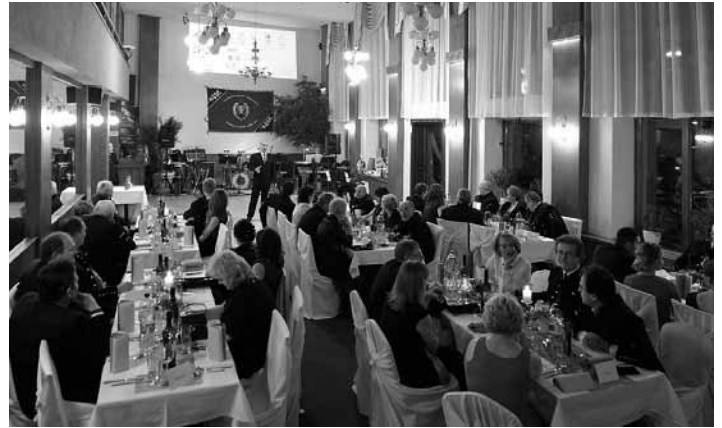
Otvorenie reprezentačného celoslovenského plesu