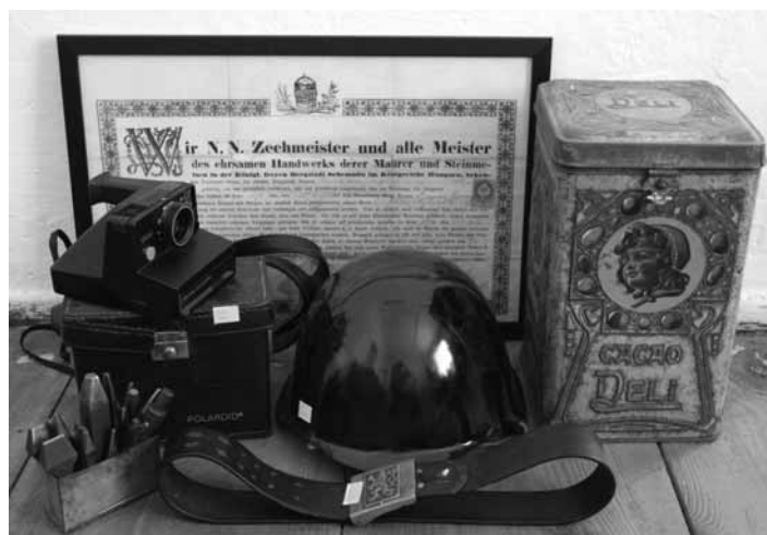
Obohatený archívny fond SBM

K spôsobom nadobúdania nových predmetov patrí aj vlastný výskum/zber. Za rok 2017 do tejto kategórie patria: kovaný náhrobný kríž (bol