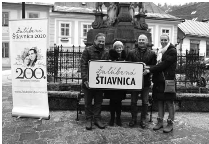
Otvorenie celoročného projektu

V tomto roku uplynie presne 200 rokov od narodenia Maríny aj Sládkoviča. Pri tejto príležitosti sa mesto Banská Štiavnica, Oblastná organizácia cestovného ruchu Región Štiavnica a Krajská organizácia cestovného ruchu – Banskobystrický kraj Turizmus spojili a spoločne pripravili projekt Zalúbená Štiavnica 2020. „Cieľom projektu je popularizovať Banskú Štiavnicu ako mesto Najdlhšej ľúbostnej básne sveta a dostať ju tak na celosvetovú mapu najzalúbenejších miest. Do spoločnosti takých