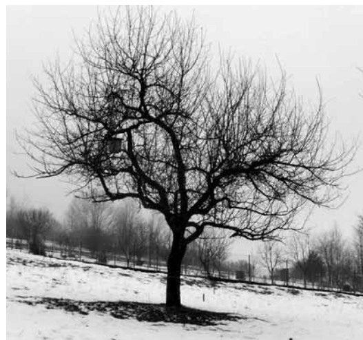
Zimný rez ovocných stromov