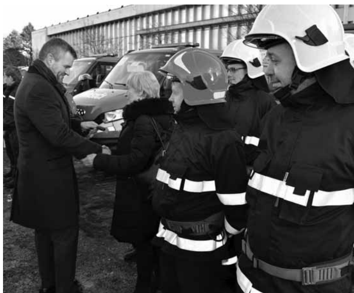
Premiér odovzdáva kľúč primátorke