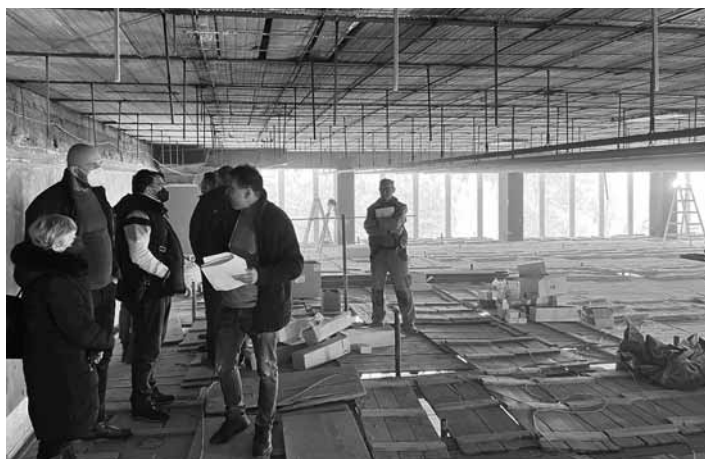
MsÚ Obhliadka rekonštrukcie stropu a vzduchotechniky

V stredu 16.2.2022 sa uskutoč- nil kontrolný deň v plavárni, kde aktuálne prebieha rekonštrukcia stropu a vzduchotechniky. Prá- ce prebiehajú v zmysle schvále- nej projektovej dokumentácie a zmluvy o dielo. Práce by mali byť celkovo ukončené v mesiaci apríl. Obnova stropu bazénovej haly prispeje výrazne k zlepšeniu jej akustiky.