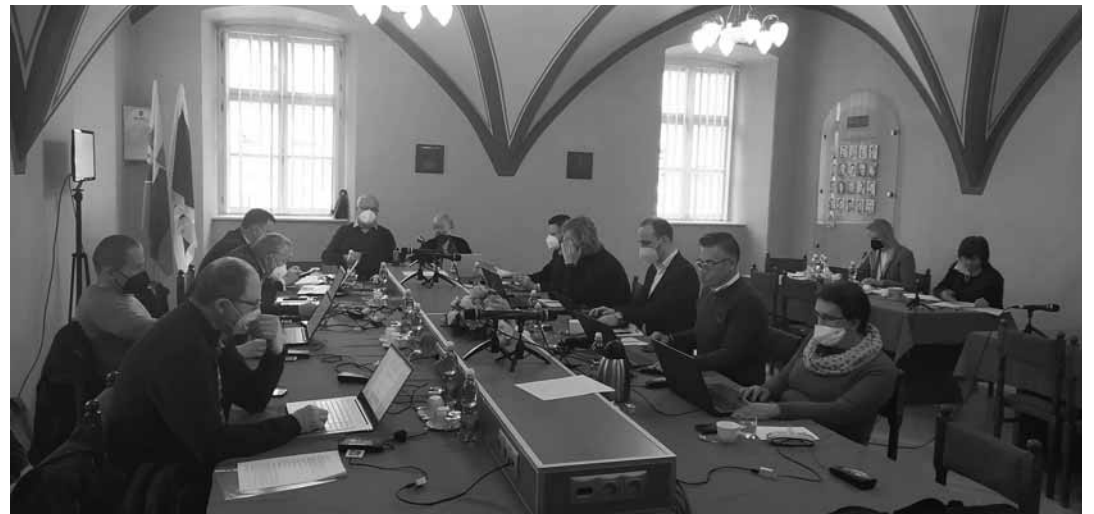
Rokovanie MsZ v zasadačke MsÚ na radnici