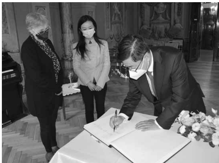
Zápis do pamätnej knihy mesta

1. str. Veľvyslanec vyslovil veľkú vďaku za srdečné privítanie, je to jeho prvá návšteva v našom meste, lokalite UNESCO na Slovensku, kde sa mu veľmi zapáčilo. Cieľom návštevy bolo nadviazať spoluprácu v oblasti kultúry, školstva, ale i cestovného ruchu. V diskusii vyznelo, že by ambasáda Čínskej ľudovej republiky v SR chcela pomôcť propagovať naše mesto na domácej pôde. Zároveň nájsť také mesto z lokalít UNESCO v ČLR, ktoré by s našim mestom malo vzájomnú spoluprácu na diplomatickej úrovni. Spoločne hľadali riešenie spolupráce, kde by mohli obyvatelia ČLR navštíviť naše mesto, spolupodieľať sa na kultúrno-spoločenskom dianí v meste, napr. vystúpeniami umelcov na kultúrnych podujatiach, výmennými pobytmi, ale aj v oblasti školstva výučbou čínskeho jazyka na školách. Primátorka mesta vyslovila úprimnú