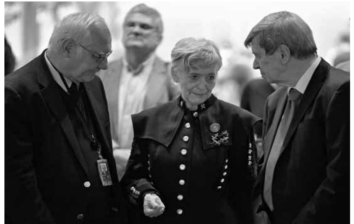
E. Kukan s primátorkou v Štrasburgu (r.2018)

Kolegyne a kolegovia, Banská Štiavnica je jediné slovenské mesto, ktoré je zapísané na Listine svetového kultúrneho a prírodného dedičstva UNESCO. Významom historických pamiatok teda siahla ďaleko za hranice Slovenska a dostalo sa im najvyššieho svetového uznania. Uznania za všetko to materiálne a duchovné bohatstvo, ktoré banskoštiavnický región svetu poskytol. Aj v dejinách Slovenska malo toto mesto viac ako dôstojné postavenie a určite nie náhodou štúrovcí práve Banskú Štiavnicu navrhli za hlavné mesto Slovenska. Hovorím o tom preto, lebo aj keď ide o minulosť, práve túto minulosť kultúrnu a pre náš národ tak vzácnu, by sme si mali zachovávať. Ona je tiež jedným zo zdrojov vlastenectva a hrdosti národa. Žiaľ, administratívnymi a necitlivými zásahmi štátnej moci boli zrušené a v tomto regióne zlikvidované vysoké školstvo, banská ťažba, boli odstáňované výskumné ústavy a vedecké inštitúcie. Región Banskej Štiavnice len po roku 1989 stratil viac ako jednu tretinu pracovných príležitostí. Bolo by preto logické zastaviť tento úpadok a dať mestu postavenie, aké mu právom patrilo a patrí aj dnes. Určiť Banskú Štiavnicu za sídlo okresu by bolo najjednoduchšou cestou