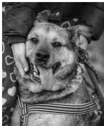
Sučka Ajda a kocúrik Boris

Počas roka 2021 sme prijali a pomáhali sme približne 350 – 400 zvieratám z nášho mesta a z okolitých miest a obcí. Naša aktivita spočíva v prijatí nechcených, túlavých a zranených zvierat. Zákonne ich ošetriť, umiestniť do útulku alebo do dočasných opatier a nájsť im domovy. Ďalšou z našich aktivít je kastračný program, ktorý funguje už od roku 2008 a jeho cieľom je zamedzenie zbytočného rodenia nechcených mačiatok či šteniatok, kedy sa snažíme odchytať a sterilizovať pouličné mačky či psy, taktiež kastrovať mačky a psy u súkromných