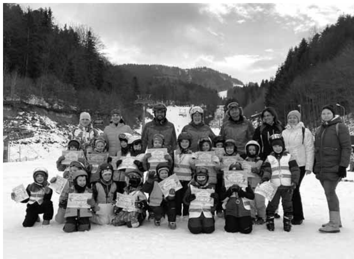
Škôlkari z MŠ 1.mája na lyžiarskom kurze

Počas piatich dní sa 7 detí korčuľiarov a 19 detí lyžiarov oboznamovali s lyžovaním a korčuľovaním a upevňovali si pozitívny vzťah k športu. Nachádzali sme sa na mieste obkolesenom lesmi a okolitými vrchmi, ktoré vytvárali dokonalú scenériu. Každé ráno sa všetky deti stretli v triede plné nadšenia a očakávania. Autobus nás vždy bezpečne dopravil na miesto diania. V deň príchodu sa deti oboznamovali s prostredím a so základnými pravidlami bezpečného správania sa. Za pomoci inštruktorov a pani učiteľiek sa deti obuli do lyžiarskeho a korčuľarskeho a nasledovala rozcvička podľa pokynov inštruktorov. Niektoré deti sa pokúsili po prvýkrát postaviť na lyže a ľad a udržať sa na nohách. Počasie bolo premenlivé, ale ani to neodradilo deti,