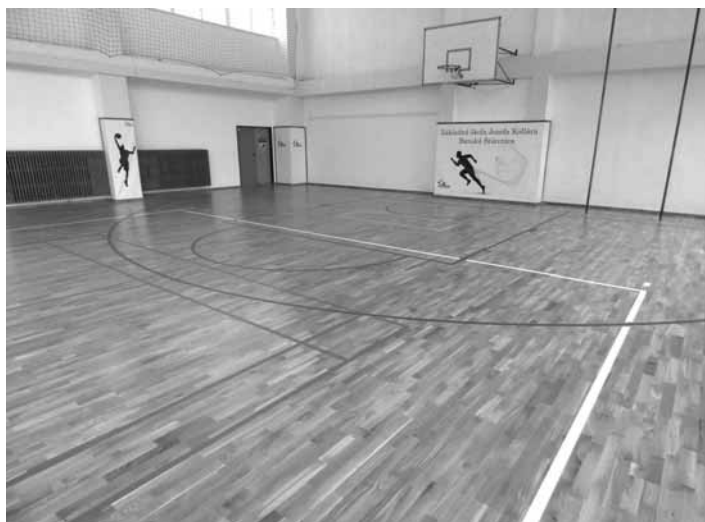
Nová podlaha v telocvični ZŠ J. Kollára

Predmetom zákazky bola výmena podlahy, ktorá už nespĺňala požadované parametre pre športové povrchy a jej poškodenia boli v niektorých častiach telocvične enormné, preto nebolo možné podlahu vymeniť lokálne ani novú podlahu položiť na existujúcu. Preto bolo nutné starú podlahu demontovať a vzápätí namontovať novú. Úspešným uchádzačom sa stala spoločnosť Para Invest, s. r. o., Bratislava, ktorej cenová ponuka bola najnižšia spomedzi doručených ponúk. Cena diela bola vo výške 44 756,90€, z čoho 30 000€ získalo mesto z Ministerstva školstva, vedy, výskumu a športu SR v podprograme OD501 – „Poskytovanie výchovy a vzdelávania v základných a stredných školách a zabezpečenie ich prevádzky“, prvku ŠPR