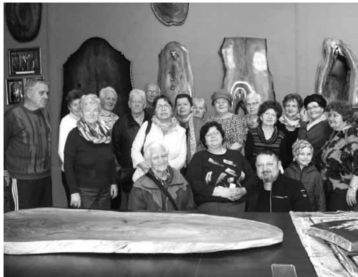
Členovia Jednoty dôchodcov v ateliéri

Pán Pál prítomných zaslávil do tajomstiev spracovania dreva, drahých kovov a drahých kameňov i postupu tvorivého procesu. No nielen to. Mali možnosť sa ich aj vlastnými rukami dotýkať a vstrebávať energiu vzácných drevín. Najväčší záujem však vzbudili kusy meteoritu, ktoré putovali z jedných rúk do druhých vlastne prvýkrát v živote. Pre viacerých prítomných to bolo súčasne aj prvé stretnutie so živým