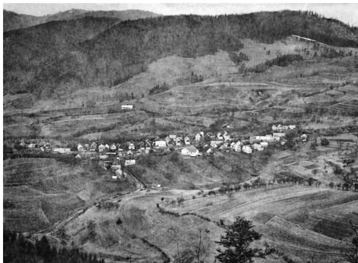
Obec Repište z r. 1930

V r. 1562 vlastnil rod Waldbrügerov Ederov z B. Štiavnice v Repišti kýzovú baňu. V banskej mape od Mateja Zipsera z r. 1747 je zakresle-