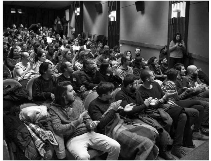
Prehliadka filmov v kine Akademik