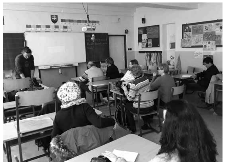
Účastníci 1. fotografického workshopu