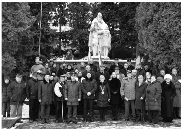
Účastníci spomienkových osláv