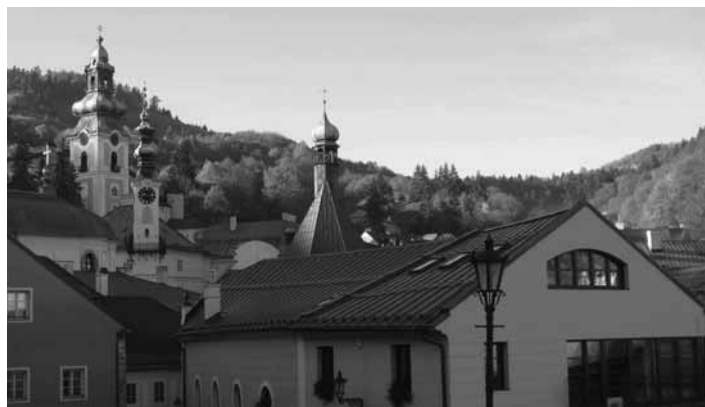
Pohľad na mesto z Novozámockej ul.

pitelstva schvaľuje primátor mesta v čiastke do 1 000 € vrátane a mestské zastupiteľstvo v čiastke nad 1 000 €. Mestské zastupiteľ-