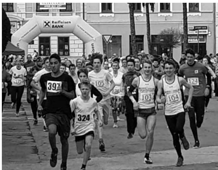
Atléti BS po štarte