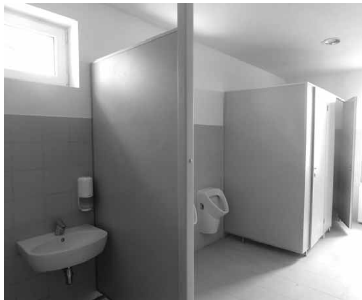
Vynovené sociálne zariadenia