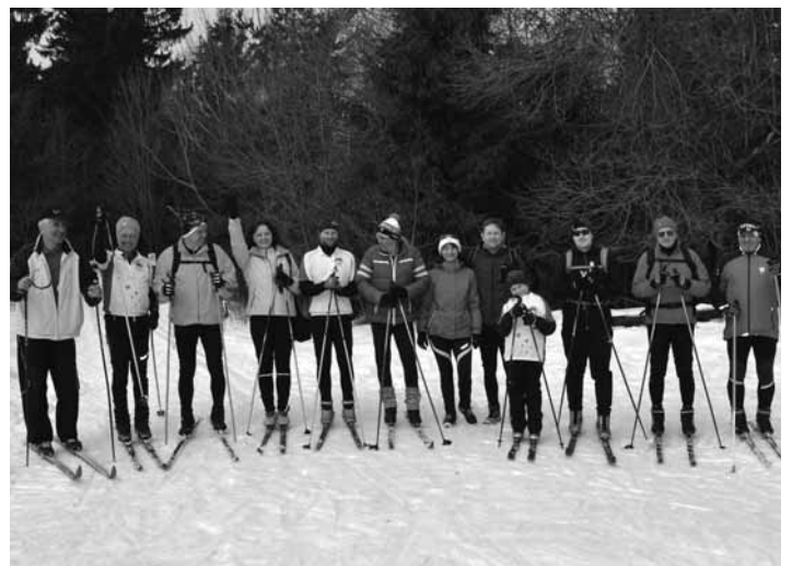
Milovníci bežkárskeho lyžovania

Po skromnejších vianočných sviatkoch nás najmä mesiac február prekvapil bohatou nádielkou snehu a rekordnými mínusovými teplotami. Využili sme každú voľnú chvíľu a pokiaľ nám to počasie a pracovné povinnosti dovoľovali, vydávali sme sa po nádherných trasách v ústrety športovo-turistickým zážitkom. A stretávali sme stále viac ľudí. Bežecké trate by sa dali pokojne nazvať príjemným bielym korzom každodenných, víkendových i náhodných návštevníkov. Niektorí tu zaznamenávali osobné rýchlostné a výkonnostné rekordy, iní si vykračovali vychádzkovým tempom obdivujú očarujúcu zimnú krajinu, ale nezriedkavý bol aj výskyt na všetko