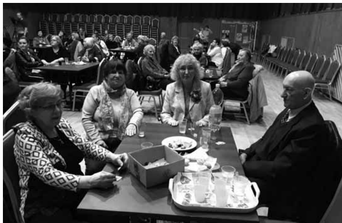
Živeniarky v Kultúrnom centre

Oslávenie 8.marca neznamenalo prežitok ani nejakú propagáciu. Bolo pripomenutím potreby rovnosti príleži-