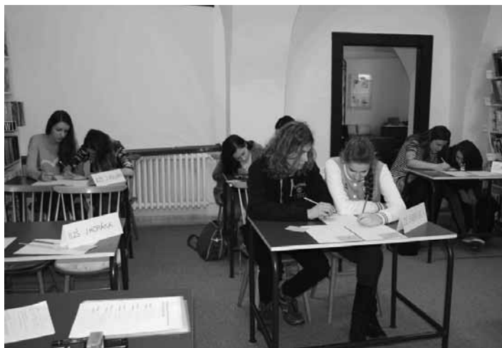
Žiaci si preverujú svoje vedomosti