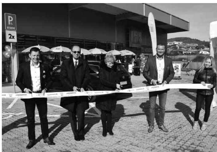
Prestrihnutie pásky pred nákupným centrom 33.str.

Na ploche 1410 m 2 pri supermarkete Tesco vzniklo nové obchodné centrum, ktoré bude slúžiť k spokojnosti nielen pre obyvateľov sídliska, ale aj občanov nášho mesta a okolia. Retail Box Banská Štiavnica sa podarilo sa veľmi krátky čas postaviť, stavba sa započala v mesiaci október 2016. Vznikli tu 3 samostatné obchodné prevádzky zamerané na drogeriový tovar – Drogeria DM, spotrebný tovar a odevy – Pepco a KiK.