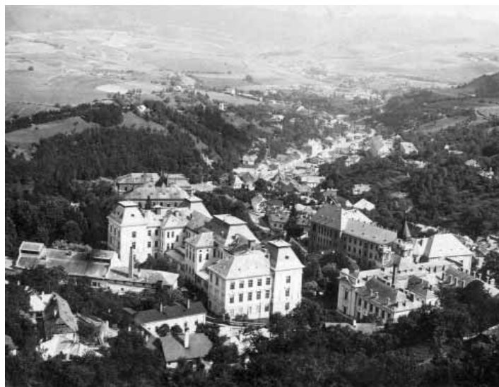
Nové budovy akadémie

Riaditeľstvo akadémie odporúčalo postaviť v Hornej botanickej záhrade novú budovu podľa pôvodného ideového návrhu na celoškolskú budovu z roku 1845. Po schválení tohto návrhu v júni 1885 obidvoma ministerstvami, sa v roku 1887 začalo pracovať na projekte a už 14. mája 1888 sa uskutočnilo slávnostné položenie základného kameňa budovy, ktorá bola postavená v novorenesančnom štýle, podľa vzoru budovy