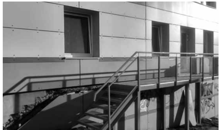
Nočľaháreň v priestoroch mestskej plavárne

Od otvorenia priestoru 1. decembra 2016 do 20.03.2017 bolo evidovaných spolu 409 prenocovaní. Evidenciu nočľahov a kontrolu