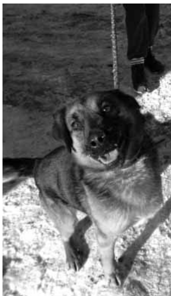
Ozzy - kríženec NO