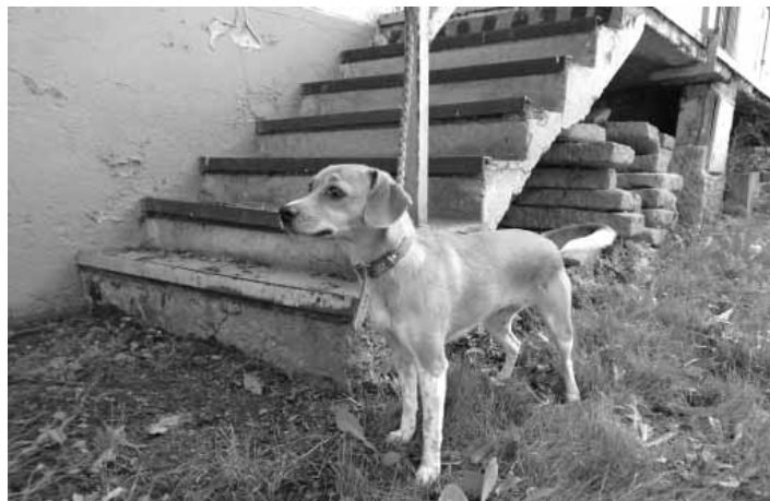
Mojka, sučka - kríženec beagla

mesta - tel.: 0917 448 515 . Môže sa stať, že Váš psík po ubehnutí ešte v zariadení nie je, stále sa túla, ale u nás si poznačíme jeho popis, telefónne spojenie a po jeho umiestnení Vám ihneď dáme vedieť.