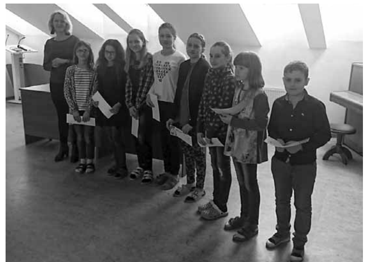
Víťazi výtvarnej súťaže

Po kultúrnom programe boli víťazom odovzdané diplomy, čestné uznania a darčeky, ktoré pre deti za-