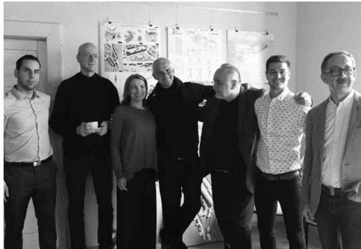
Odborná porota architektov