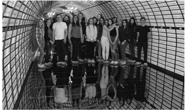
Študenti Školského internátu pri SOŠ lesníckej