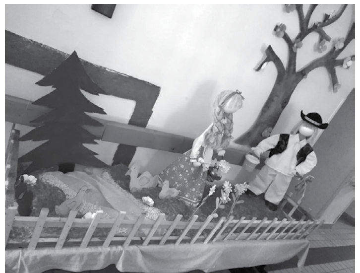
Originálna jarná výzdoba