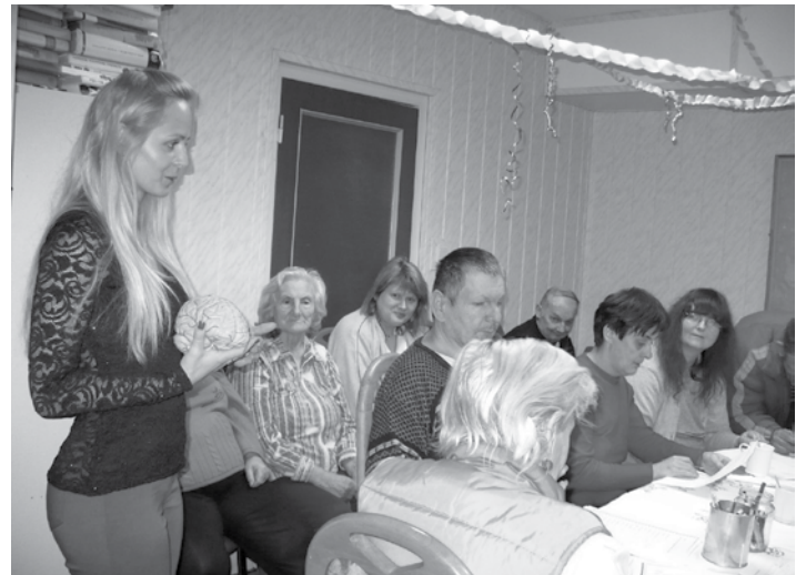
Prednáška o mozgu pre klientov Domova Márie

Okrem týchto akcií, prebiehajúcich každý deň vo všetkých troch našich budovách, Domov Márie pripra-