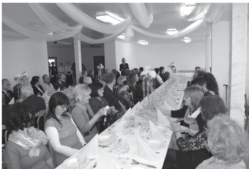
Banskoštiavnický pedagogický zbor

Je toho veľa a my dospelí to musíme vidieť, chápať a oceňovať už dnes, na rozdiel od Vašich žiakov,