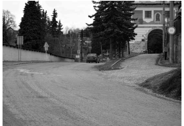
Ulica Andreja Sládkoviča pred rekonštrukciou

Pre rok 2018 bola Mestu Banská Štiavnica pridelená dotácia vo výške 700 tisíc EUR. V roku 2018 sa teda zrekonštruje posledná etapa úpravy ulice Andreja Sládkoviča a začne sa následne I. etapa ulice Antona Pécha. Rekonštrukcia ulice Antona Pécha sa bude realizovať opačným smerom, to znamená od hornej koncovej časti smerom dolu k Slovenskému vodohospodárskemu podniku š.p. Realizácia úprav ulice Andreja Sládkoviča bude prebiehať od 9. apríla do konca mája 2018 a ulica Antona Pécha, od 23. apríla maximálne do 15.7.2018.