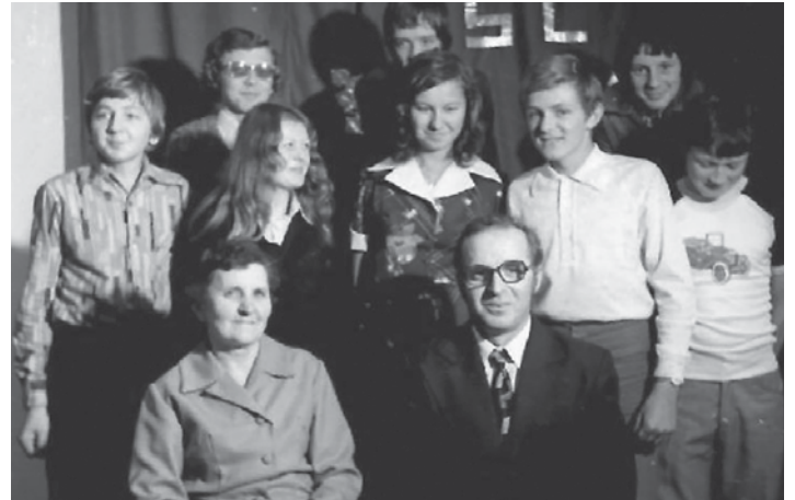
Zbor banskoštiavnickej ľudovej školy umenia

V povojnových rokoch sa potreba založiť v B. Štiavnici hudobnú školu stávala čoraz naliehavejšou. Hudobná odborná komisia pri OOR v B. Štiavnici na svojom zasadnutí v roku 1949