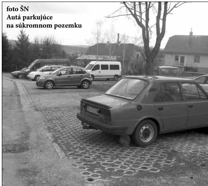
Autá parkujúce na súkromnom pozemku