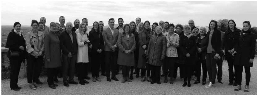
Účastníci 1. workshopu projektu Podzemná Európa

Projekt s názvom Cesty po lokalitách svetového dedičstva v Európskej únii (World Heritage Journeys in the European Union) je zameraný na prezentáciu výnimočného kultúrneho a prírodného dedičstva, ktorým Európa oplýva. Do projektu sú zapojené lokality svetového dedičstva UNESCO, v ktorých sa odráža hĺbka a rôznorodosť európskej kultúry, bohatá história a spôso-