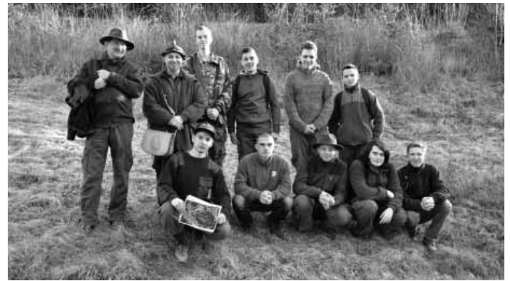
Spoločné foto študentov v PR MsLesy B. Štiavnica

Sluka nielen bola, ale stále znamená symbol jari, úcty k prírode i k etike lovu. Za čias minulých, avšak nie tak dávnych - pár rôčkov späť, keď sa ešte uvádzilo lovila na jarom ťahu bolo zvykom poľovníkov pri prvej videnej sluke zodvihnúť klobúk a pozdraviť ju. Každý samozrejme po svojom: „Vítaj v našom krásnom kraji!“, či „Lesu a Lovu Zdar! milí priatelia!“, ale aj „Ej! už sme ťa čakali a vedz, že sa u nás budeš mať dobre“.