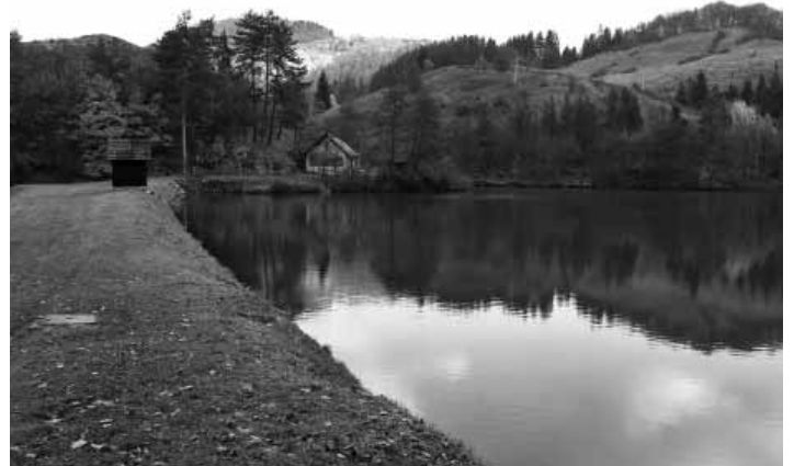
Tajch Halča pred rekonštrukciou

V minulom roku sa uzatvorila náročná etapa 4 rekonštrukcií, ktoré prebiehali takmer súčasne, t.j.