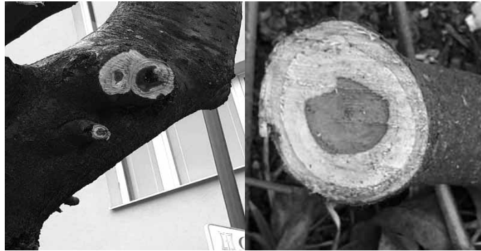
Dreviny sa opíliť o 1/3 a odstrániť sa poškodené a choré konáre napadnuté jadrovou hnilobou tak, aby nespôsobili žiadnu ujmu na zdraví a majetku občanov mesta. (foto – jadrová hniloba jarabín z Dolnej ulice).

Ďalším dôvodom, pre ktorý reagujeme na Váš článok, je plánovaná nová sadovú úprava priestoru na ulici Dolná, áno je to presne ten priestor (o ktorom píšete), v ktorom sú mnoho rokov nasadené dreviny rôzneho druhu (jarabina vtáčia, jaseň štíhly, svíb biely a rôzne okrasné kríky). Novú sadovú úpravu chceme riešiť na troch plochách medzi miestnou komunikáciou a chodníkom pre peších na Dolnej ulici, po štiavnicky od Šindlerky po začiatok objektu bývalej predajne Gizka. Celková plocha riešeného priestoru je 812 m 2 . Cieľom sadových úprav je novou výsadbou zabezpečiť skrášlenie ulice, vytvorenie izolácie medzi miestnou komunikáciou a chodníkom pre peších pomocou stromov, krov, trvaliek a okrasných tráv. Navrhované