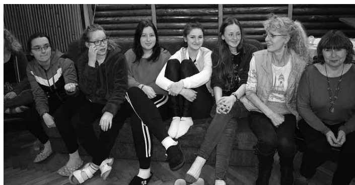
Beseda v klube mládeže škol. internátu SOŠL

Máme svätú povinnosť hľadiť nepokojné pierka vo vlasoch a strážiť kľúče od okridlených túžob mladosti. Áno, nevinnosť treba chrániť, aby si o slobodu nezranila krídla a aby ju túžba po láske neuvrhla do cely osamelosti. Aj preto sme sa pokúsili hľadať odpovede, tentoraz vo výlučne dámskom zložení lesníckeho internátu, na otázky sebaúcty, zložitosti medziľudských vzťahov, sily priateľstva, ale najmä vzletov i úskalí prvých študentských lások. V príjem-