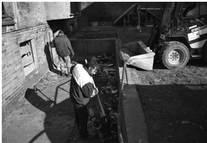
Veľká jarná brigáda

Jarného upratovania okolo bytoviek na Šobove a ich okolí sa zúčastnili hlavne obyvatelia z tejto lokality. Bola to už v poradí 3. brigáda a hlavnou myšlienkou zorganizovania bolo zaktivizovať rómskych občanov, ktorí by sa spolupodieľali na vyčistení tohto priestoru. Mestská polícia v spolupráci s Komunitným centrom Šobov zaktivizovala občanov, deti, rodičov, dospelých a celé rómske rodiny, aby vyčistili bezprostredné a širšie okolie tejto lokality, čo sa im aj podarilo. Technické služby, m. p., Banská Štiavnica zabezpečili veľkokapacitné kontajnery, do ktorých sa odpad zbieral. Koordináciu jednotlivých prác a samotné organizovanie bolo zabezpečené príslušníkmi