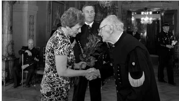
Blahoželanie jubilantovi na radnici