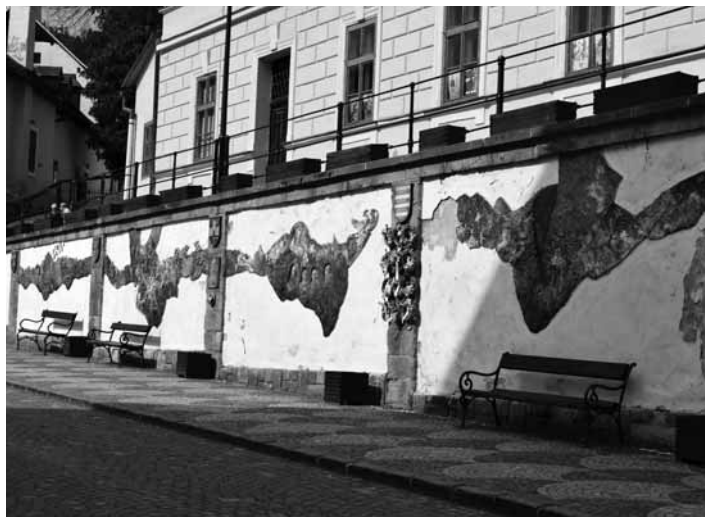
Keramické plastiky na Radničnom námestí FOTO MICHAL KRÍŽ 33.str.

Uvedený zlý stav Mesto Banská Štiavnica začalo riešiť postupne, tak, že každý rok od roku 2016 sa vyspravila jedna podkladová plocha pod keramickým reliéfom. Zlý stav podkladov však nasvedčoval tomu, že uvedený problém nestačí riešiť postupne, preto sa Mesto Banská Štiavnica rozhodlo uskutočniť v roku 2018 sanačné práce na opornom múre na Radničnom námestí pod keramickými reliéfmi kompletne v počte zostávajúcich 5 kusov polí, 2 polia už boli v roku 2016 a 2017 vyspravené.