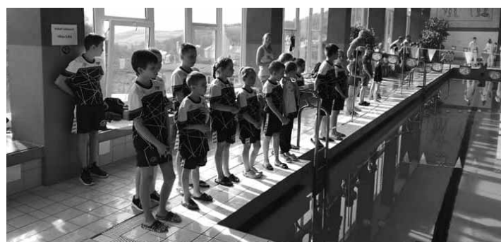
Štiavnické plavecké nádeje pred štartom pretekov

Bali Michaela: 5. 50m VS - 46.59; 7. 100m VS - 1:48.37; 8. 50m Z -