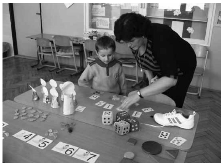
Čo by mal budúci prvák vedieť?

Vstup dieťaťa do základnej školy považujeme za dôležitú životnú zmenu. Zaškolenie je jedným z najdôležitejších životných medzníkov. Vstupom do školy sa zásadne mení spôsob života dieťaťa. Školské dianie ovplyvní život žiaka na dlhý rad ďalších rokov. Vôbec nie je zanedbateľné, aké skúsenosti počas týchto rokov dieťa nadobudne. Hrová činnosť, ktorá bola v predškolskom období dominantnou, ustupuje do pozadia a do popredia sa dostáva činnosť učebná. Naša škola v rámci spolupráce s materskými školami otvára deťom