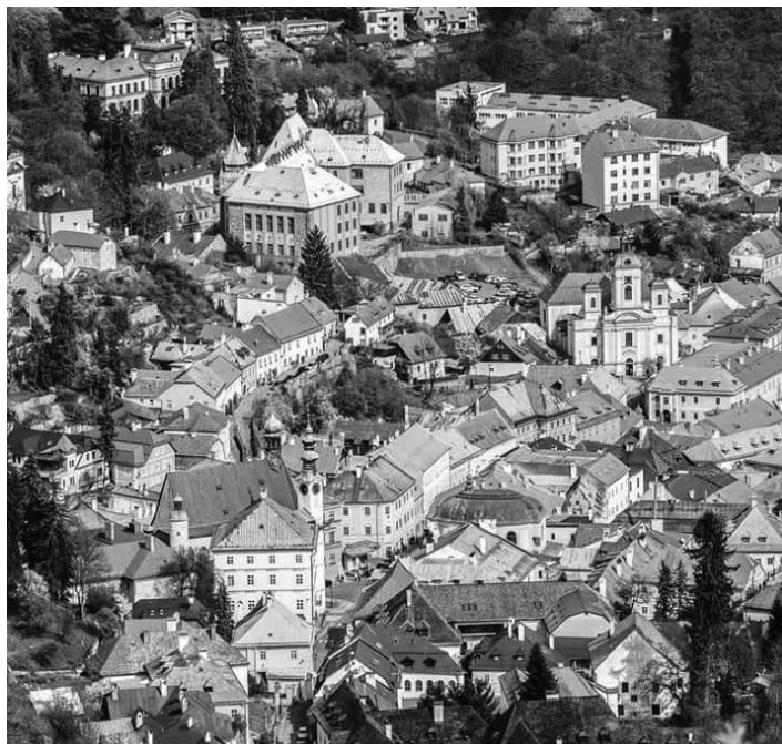
Panoráma Banskej Štiavnice

Sergej Protopopov propagoval Banskú Štiavnicu v mnohých odborných a obrázkových časopisoch doma a v zahraničí, ale mesto Ban-