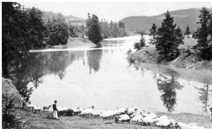
Rozgrund FOTO ARCHÍV AUTORA

Hrádza vodnej nádrže vysoká 23,2 m bola treťou najvyššou hrádzou v okolí Banskej Štiavnice. Dĺžka koruny hrádze je 138 m, šírka 8 m. Zberné jarky vodnej nádrže majú dĺžku 2 km. Vodná nádrž zásobovala vodou banské strojné zariadenia a následne aj stupy vo Vyhnianskej doline, neskôr sa voda prečerpáva cez Červenú studňu do Vodárenskej nádrže, odkiaľ otekala po filtrácii vlastným spádom do mestského vodovodu. Vodu z vodnej nádrže využíval aj vyhniansky pivovar. Od roku 1981 sa stal no-