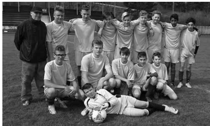
Mladší a starší žiaci FK Sitno Banská Štiavnica

Uplatňujete v príprave aj svoje skúsenosti atléta, mimochodom, vraj máte ešte jeden slovenský rekord?