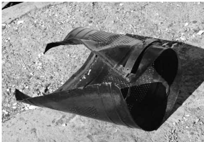
Poškodený koš po výbuchu pyrotechniky