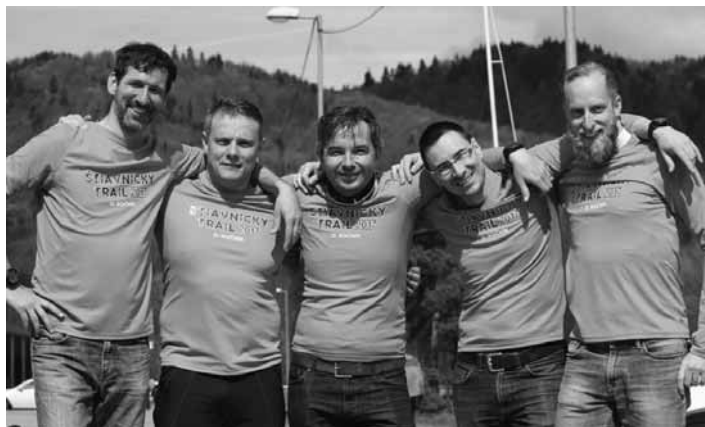
Organizačný tím pretekov