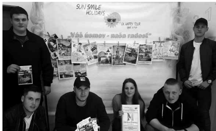
Žiaci štvrtého ročníka získali druhé miesto