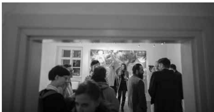
Vernisáž výstavy