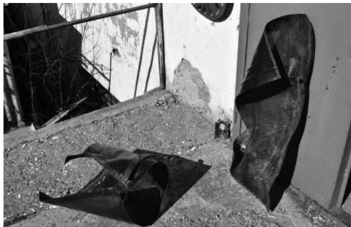
Deformácia smetných košov

Nebolo tomu inak ani tento rok, keď si partia občanov vyšla na kopec k Novému zámku, odkiaľ je vidieť ohňostroje strieľané na celom území mesta. Niet krajšieho privítania Nového roka až nato, že pracovníci Technických služieb, m.p. pri vyprázdňovaní smetných košov umiestnených na stĺpoch verejného osvetlenia zistili, že všetky boli rozstrieľané a poškodené. Totiž, niektorý z oslavujúcich občanov asi za účelom zefektívnenia strelby nahádzal ohlušujúce petardy do smetných