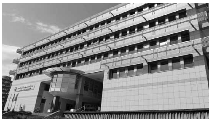
Ministerstvo zdravotníctva SR

V rámci programu zasadnutia boli vyhodnotené úlohy z uznesenia 27. snemu ZMOS a vyhodnotenia požiadaviek zo snemov regionálnych združení a námietok z diskusných príspevkov 27. snemu ZMOS. Jednalo sa práve o námety z diskusného príspevku, s ktorým som vystúpila na 27. snemu ZMOS k téme zdravotníctvo s návrhom jeho ďalšieho riešenia, ktoré vychádza zo situácie v našom meste, ale s rovnakými problémami zápasia aj ďalšie menšie okresné mestá na Slovensku,