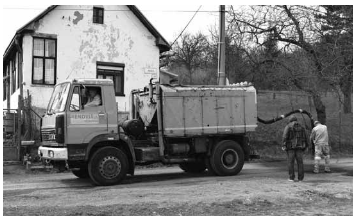
Vysprávky ciest realizovala firma Renovia, s.r.o.

Celoplošná vysprávka chodníka na Ul. L.Svobodu k supermarketu Tesco teplou obaľovanou zmesou o celkovej rozlohe 100 x 3,5m (350m 2 ). Na túto časť prístupovej cesty k jednotlivým bytovým jednotkám na sídlisku Drieňová bolo použitých 39,49 t obaľovacej zmesi, asfaltu v celkovej výške 6 113,05 eur,