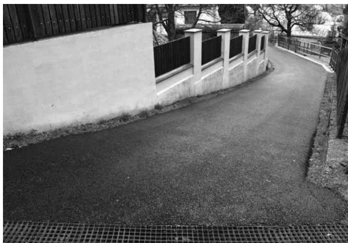
Nový asfaltový povrch

Nakoľko po dlhej zime nastali na komunikáciách veľké výmole a miestne komunikácie boli v dezolátnom stave, museli sa niektoré úseky vyspraviť celoplošne. Prinášame Vám prehľad miest spolu s fotodokumentáciou, na ktorých uliciach sa vysprávky uskutočnili v I. etape: Ulica J. Gagarina - Oprava miestnej komunikácie na Ul. J. Gagarina teplou obalovanou zmesou o celkovej rozlohe 210 x 3m (630m 2 ).