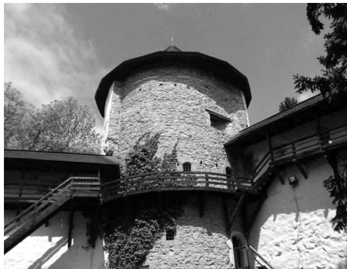
Výmena krytiny dreveného šindľa