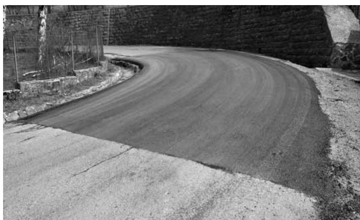
Ostrá zákruta na Mládežníckej ulici