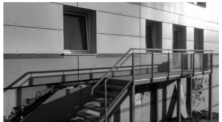
Nočláreň v priestoroch mestskej plavárne

Tento priestor sa pre občanov otvoril 1. decembra 2017 a zatvorený bol 15. apríla 2018. Priestor je vybavený sprchovým kútom, WC, kuchynkou a počtom lôžok 10. Občania žijúci na „ulici“ tu mali možnosť prenocovania, ako aj zabezpečenia osobnej hygieny a starostlivosti o bielizeň prostredníctvom prania a sušenia. Čistotu priestoru a obsluhu spotrebičov zabezpečoval správca, ktorý bol tiež jedným z občanov bez domova. Jednotlivé služby boli spoplatnené vo výške 0,50€/noc, 0,10€/sprchovanie a 0,20€/pranie, sušenie. Za uvedené obdobie evidujeme 1.301 prenocovaní. Spolu sa vyzbieralo 398,50€ za