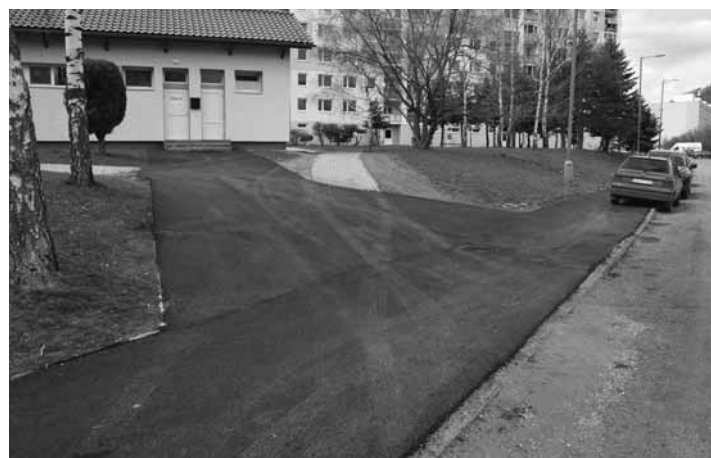
Nový chodník na Ul. bratská