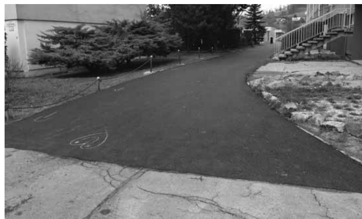
Nový chodník na Ul. L. Svobodu