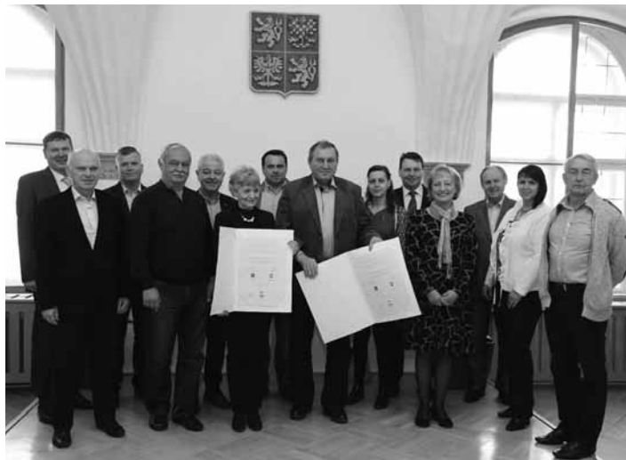
Zástupcovia Moravskej Třebovej, Banskej Štiavnice a Slovenského inštitútu v Prahe na radnici v Moravskej Třebovej

Organizátori sa tento rok rozhodli preniesť festival „do ulíc“ a sprístupniť ho tak väčšiemu počtu ľudí. Taktiež rozšírili program festivalu a poskytli viacej priestoru umelcom z Banskej Štiavnice.