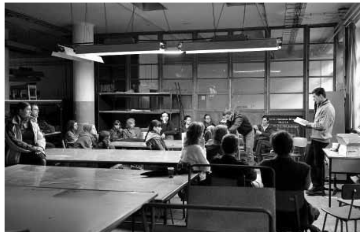
Minulý rok sa čítalo i v Plete

Okrem "starej nemocnice" sa bude čítať v prízemí na Novom zámku, v podkroví Klopačky, vo vstupnej bráne na Židovskom cintoríne a v miestnej ZUŠ-ke. „Ľuďi pozývame i do priestoru skladu nášho antikvariátu. Odporúčame, aby sa návštevníci prešli lesným chodníkom cez Frauenberský