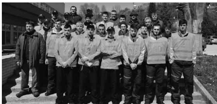
Pilčíci zo stredných lesníckych škôl

Žiaci súťažili v trojčlenných družstvách, ale aj ako jednotlivci v týchto disciplínach: stínka, výmena reťaze, kombinovaný rez, rez na podložke a odvetvovanie. Každá disciplína mala svojho víťaza, z ktorých bol potom určený jeden absolútny víťaz, ktorý získal najvyšší počet bodov vo všetkých disciplínach. Študenti súťažili s motorovými píslami Husqvarna, vybavenými ori-