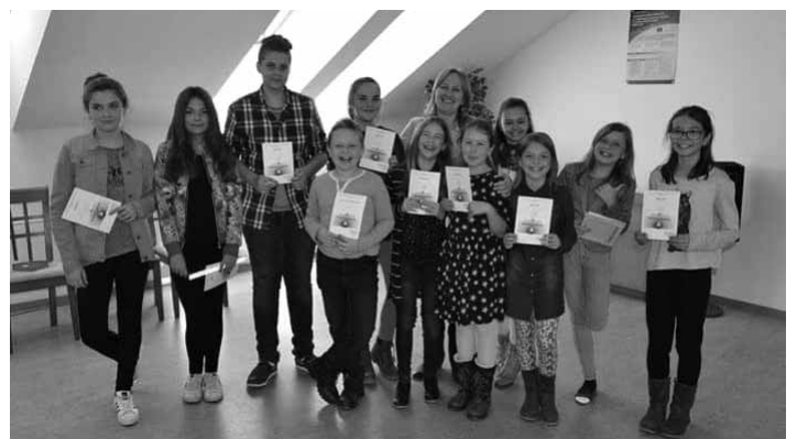
Víťazi súťaže