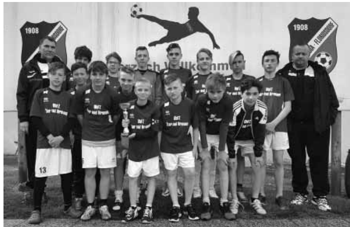
Víťazný žiacky výber ObFZ