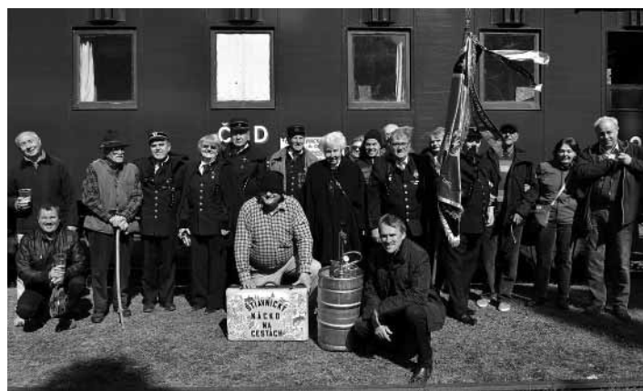
Účastníci podujatia pred historickým vlakom