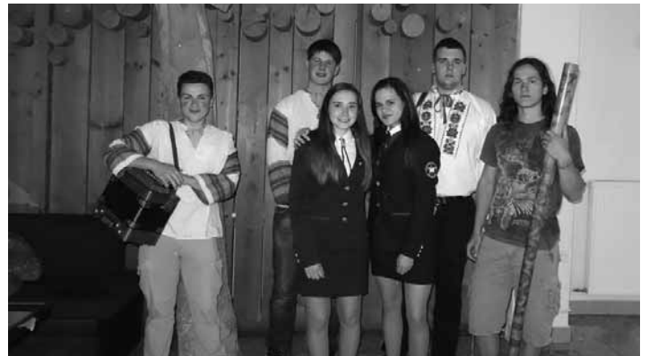
Účinkujúci so SOŠL na Art pódium