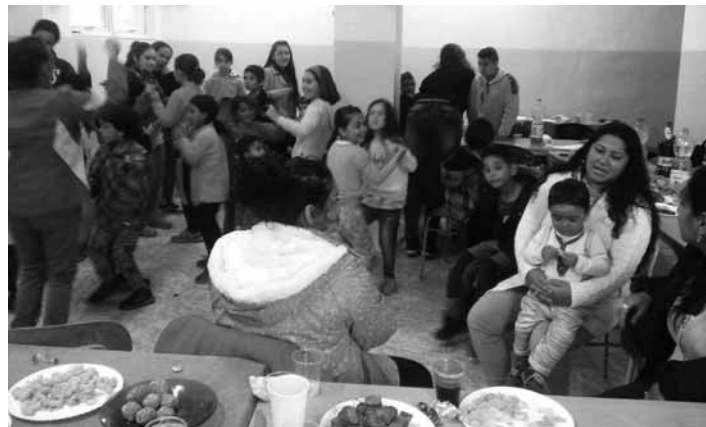
Rómska zábava v plnom prúde

Medzinárodný deň Rómov, ktorý je oficiálne dňa 8.4.2017, ale z dôvodu nepriaznivého počasia sa preložil na deň 28.4.2017. Tento deň je príležitosťou na oslavu rómskej hrdosti, identity a kultúry, ale aj na vyjadrenie solidarity s Rómami. Pri tejto príležitosti organizujú kultúrno-spoločenské podujatia, ktorých cieľom je zvýšenie povedomia o ich kultúre.