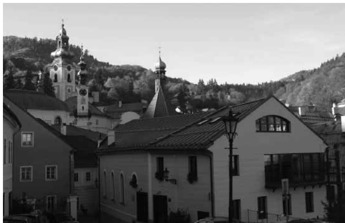
Pohľad na Novozámockú ulicu

V rámci úprav verejných priestranstiev bude zrealizovaná II. etapa rekonštrukcie Ulice Andreja Sládkoviča, ktorá v sebe zahŕňa vybudovanie novej komunikácie a chod-