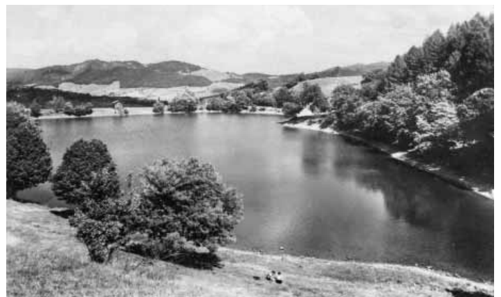
Beliansky tajch

biehala v rokoch 1999 - 2002 s dôrazom na zachovanie charakteristických znakov vodného staviteľstva minulosti. Novovybudované funkčné objekty ako dno-