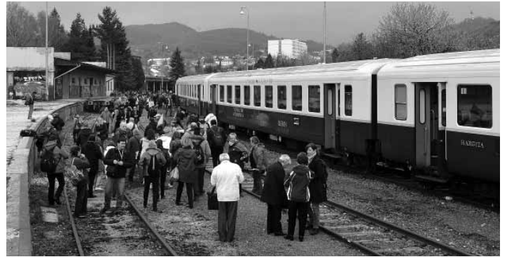
Salamandra Expres v B. Štiavnici

K príjemnému pobytu prispeli aj reštauračné zariadenia v meste, ktoré bezproblémovo zvládli pripraviť obedy a občerstvenie pre tak veľký počet návštevníkov.