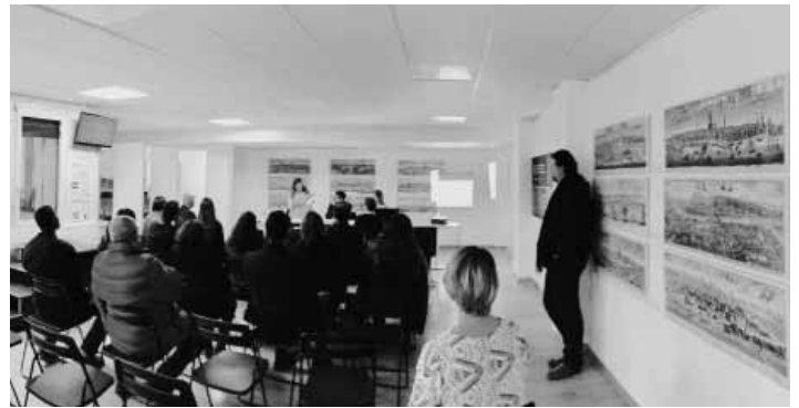
Výstava „Tajomné grafiky“ na Generálnom konzuláte Brazílie v Ženeve