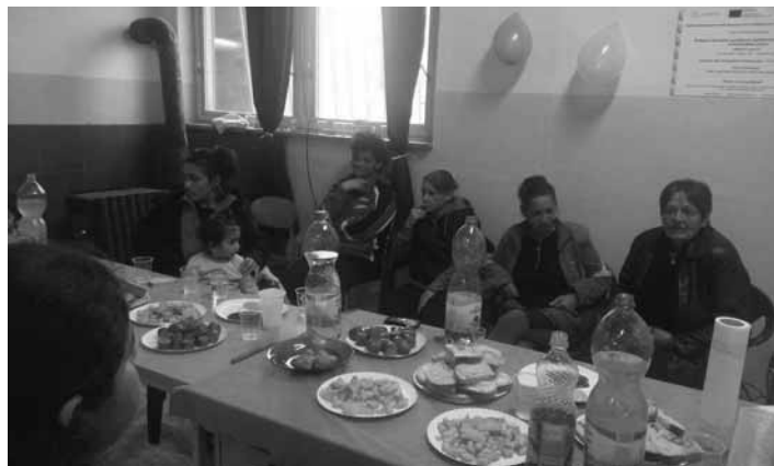
Posedenie v komunitnom centre

Pre obyvateľov Šobova si pracovníci KC pripravili občerstvenie a celá aktivita bola doprevádzaná rómskou hudbou a tancom. Pre najmenších si pracovníci KC pripravili súťaž o najlepší rómsky tanec a najlepší rómsky spev. Najlepšie umiestnenia boli ohodnotené sladkou odmenou. Celá komunitná aktivita bola uskutočnená ako oslava dňa Rómov, pri ktorej sa posilňovali medziľudské vzťahy a prekonávali sa osobné bariéry medzi ľuďmi žijúcimi v komunite Šobova.