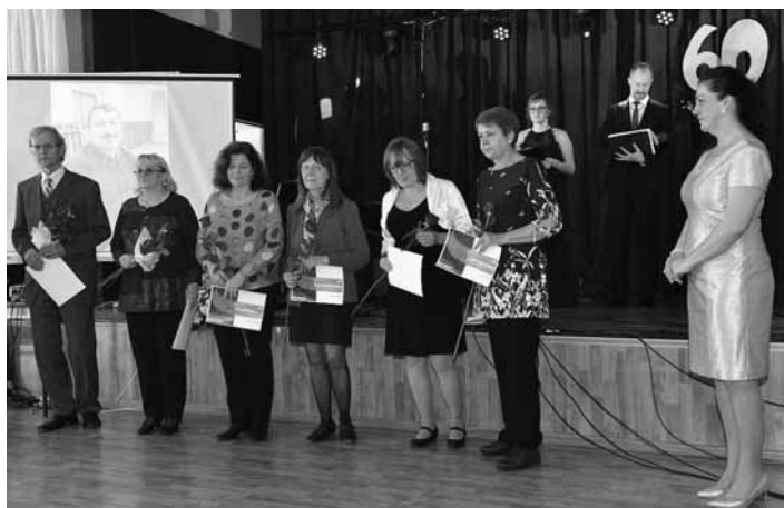
Ocenení pedagógovia ZUŠ