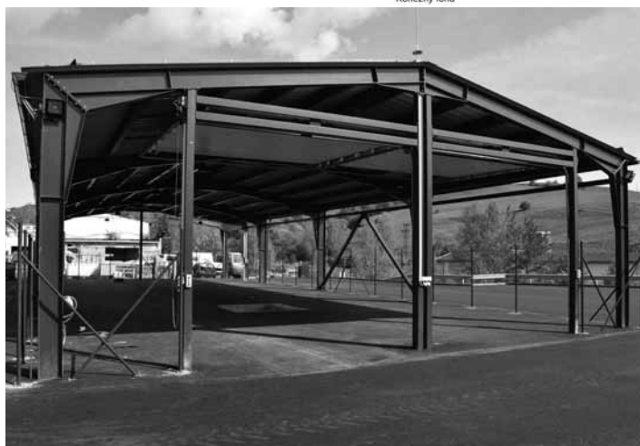
Objekt kompostárne v areáli TS, m.p.