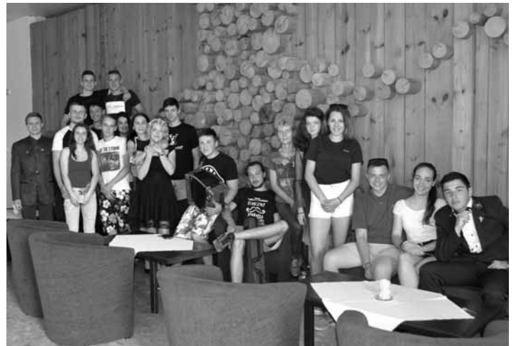
Mladé talenty zo SOŠ lesníckej