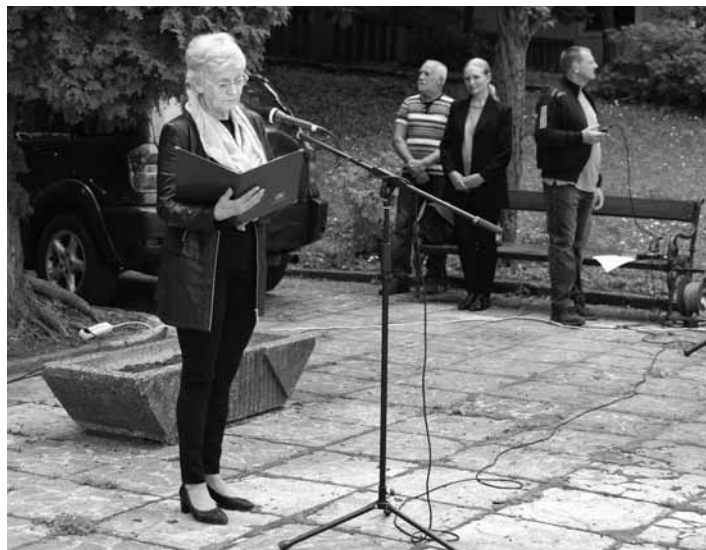
Príhovor predniesla primátorka nášho mesta

jov, ktoré prebiehali na území štátov Európy. Smutným výsledkom tohto zápasu za slobodu národov je bezmála 60 miliónov ľudských životov vojakov a nevinných obyvateľov, pokusy na ľudoch, zničené a vydrancované mestá, dediny, továrne, zamínované polia, zničené kultúrne a historické pamiatky i skvosty prírody. Udalosti II. svetovej vojny neobišli ani Slovensko, môžeme byť hrdí na to, že Slováci sa nezmiarili s fašizmom a bojovali za svoju vlasť a jej slobodu.