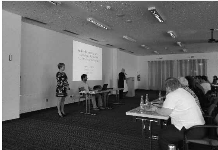
Otvorenie odborného seminára

Štiavnické noviny, ktorým šéfujem viac ako 10 rokov vychádzajú nepretržite už vyše 29 rokov. Majú niekoľko atribútov, ktoré vo svojom komplexe nemajú určite obdobu na Slovensku, ani v prípade ďaleko väčších miest ako je Banská Štiavnica. Nielenže vychádzajú nepretržite od marca 1990, ale nepoznám podobné noviny na Slovensku, ktoré by vychádzali už 29. rokov bez akéhokoľvek prerušenia. Sú týždenníkom, vydáva ich Mesto Banská Štiavnica a nedostávajú ich občania zdarma, ale si za ne platia. Cena jedného výtlačku je 40 centov. Každé číslo má minimálne 12 strán, ale v prípade príloh ich rozsah býva aj vyše 40 strán. Jediným redaktorom tohto týždenníka som ja, akurát, že mi grafickú a jazykovú korektúru robia dvaja ľudia na minimálny úväzok. Hovorí sa denno-denne o tom, aké majú byť médiá. Naše novi-