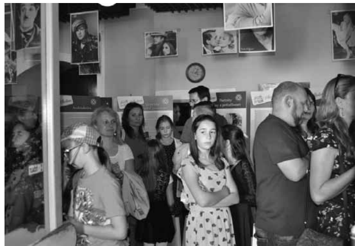
Vernisáž výstavy v kine Akademik