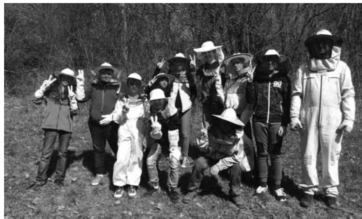
Malí včelári z katolíckej spojenej školy

Malí nadšenci a odvážlivci Katolíckej spojenej školy sv. Františka Assiského v Banskej Štiavnici vo veku od 9 do 14 rokov už druhý rok pracujú ako včelárski učni a naberajú skúsenosti z praktických i teoretických vedomostí začínajúcich včelárov. Neodradili ich ani žihadlá našich kamarátok, ani zlomené vrtáčky a prsty poranené nerezovým drôtkom pri príprave rámkov a mamy sa nehnevali ani na zablatené kolená, obuv a machule farby na ich školskom oblečení, ktoré sa „podarilo“ pri príprave úľa a včelnice pre naše školské včielky. Dokonca ani skúseným starým včelárskym majstrom v našom regióne i Želiezovciach nevadila naša prítomnosť, tmolenie sa