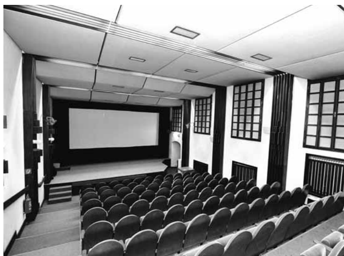
Nové sedačky už začiatkom leta!

Obrovský divácky úspech slovenských filmov v kombinácii s tradične silnými hollywoodskymi trháčkami spôsobil aj nárast návštevnosti v kine Akademik, ktoré v roku 2017 navštívilo približne 14 500 divákov. Aj tento záujem zaväzuje pracovať na ďalšom zveľaďovaní tohto kultúrneho stánku. Mimoriadne nás preto už v minulom roku potešila podpora primátorky mesta,