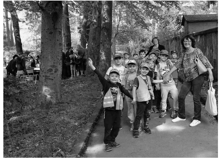
Deti z MŠ 1.mája v Botanickej záhrade

Partneri: Mestské lesy Banská Štiavnica, spol. s.r.o., Múzeum vo Svätom Antone, IBO, s.r.o. Zvolen, Slovenské múzeum ochrany príro- dy a jaskyniarstva Litovský Mikuláš, Slovenský zväz včelárov B.Štiavni- ca (p. Mlynarčík), Slovenský rybár-