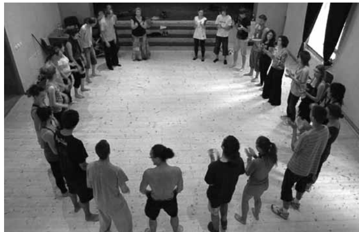
Vzdelávací seminár v Prenčove

V rámci tohto tréningu sa 18.mája 2018 uskutoční "festival príbehov", ktorý je otvorený pre verejnosť a organizátori každého srdečne pozývajú. Ak poznáte dobrého rozprávača,