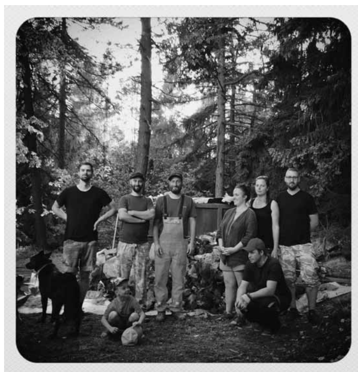
Dobrovoľníci na Červenej studni

Členovia občianskeho združenia Nad Tým - Červená Studňa