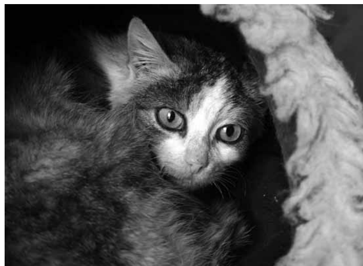
Nie je nám ich osud lahostajný FOTO OZ TL

OZ túlavá labka sa venuje kastráciám mačiek a psův hlavne v našom meste, v našom depozite, v rímskej časti mesta, nechcených zvie-