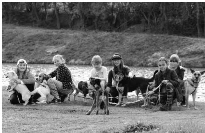
Priatel'ia štvornohých miláčikov

Za ten čas sme zachránili nespočetné množstvo psov aj mačiek z našich ulíc či z osád, či už vyhodných, alebo týraných... Už 9-ty rok máme rozbehnutý kastráčny program, ktorým pomáhame s kastráciami pouličných mačiek a psov, či zvierat v osadách, na sídliskách, u súkromných osôb, atď. Ide nám o to, aby sa zbytočne zvieratá nemnožili, pretože dopyt a ponuka domova pre zvieratko je oveľa nižšia ako ich ponuka. Ak by niekto chcel patriť k nášmu tímu, budeme radi. Potrebujeme hlavne pomáhať s venčením v našom záchranom depozite, so starostlivosťou o zvieratá (psy aj mačky). Neustále hľadáme šikovných ľudí, čo by nám pomohli napr. s prevozom zvieratá (veterinár, nový domov...). Tak isto hľadáme ochotných ľudí, čo by pomáhali