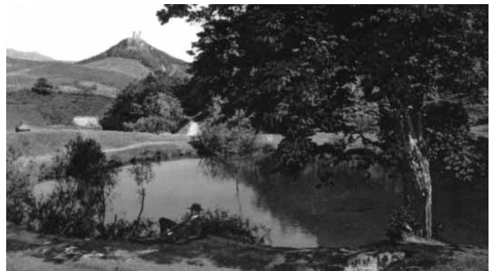
Michalštôlniansky tajch

O niečo vyššie ležiaca Horná Michalštôlnianska vodná nádrž už neexistuje, pretože ju od roku 1975 postupne zasypali odpadovým materiálom z Novej šachty. Najstaršia zmienka o oboch vodných nádržiach pochádza z roku 1651. V rokoch 1752 až 1906 patril závod aj s vodnými nádržami Gerambovej banskej únie. V roku 1906 ich prevzal bankský erár. Voda z Michalštôlnianskych vodných nádrží sa využívala na pohon stúp a na premývanie rudy. Keď v roku 1909 v slepej šach-