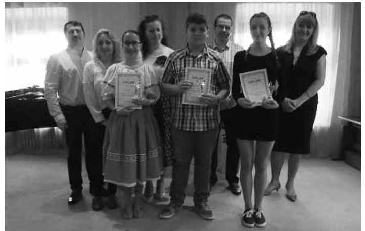
Ocenení v kat. 7. - 9. ročník ZŠ