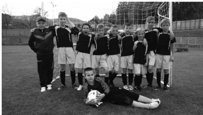
Futbalová prípravka FK Sitno BS

Zápas za ideálneho počasia sa musel početnej diváckej kulise páčiť. Prispelo k tomu nasadenie hráčov obidvoch mužstiev. Naši chalani začali bez rešpektu, nakoľko súpera porazili na zimnom halovom turnaji, čo im dodalo viac sebavedomia. Zápas sa niesol v dobrom tempe a chlanci sa museli vysporiadať s nasadením a tvrdosťou súperových hráčov. Aj napriek tomu sme si v prvom polčase dobrou kombinácnou hrou vytvorili niekoľko dob-