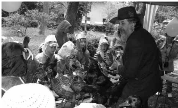
Poznávanie vtákov v prírode

de sa zúčastnili aj lesníci z múzea vo Svätom Antone, ktorí mali na starosti stanovište poznávania vtákov v prírode a ochranári zo Slovenského múzea ochrany prírody a jaskyniarstva v Liptovskom Mikuláši, ktorí deťom priblížili prácu jaskyniarov. Pre mladých návštevníkov bol určite zaujímavý aj bývalý študent lesníckej školy pán Hlásnik, ktorý imitoval zvuky zverov. Tak ako v predchá-