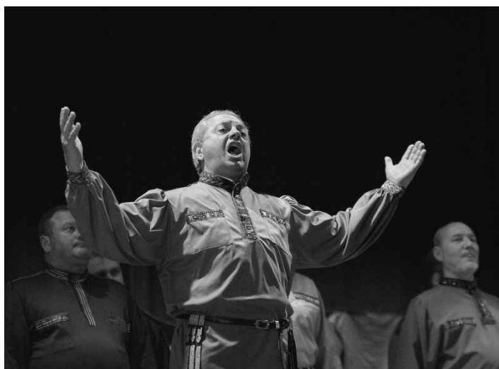
Vystúpenie Donských kozákov