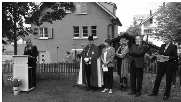
Príhovor prednostky MsÚ za účasti veľvyslankyne SR vo Švajčiarsku a primátorky mesta Hünenberg