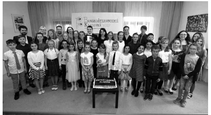
Účastníci klavírneho koncertu