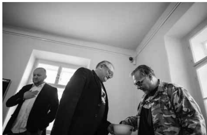
Z otvorenia výstavy