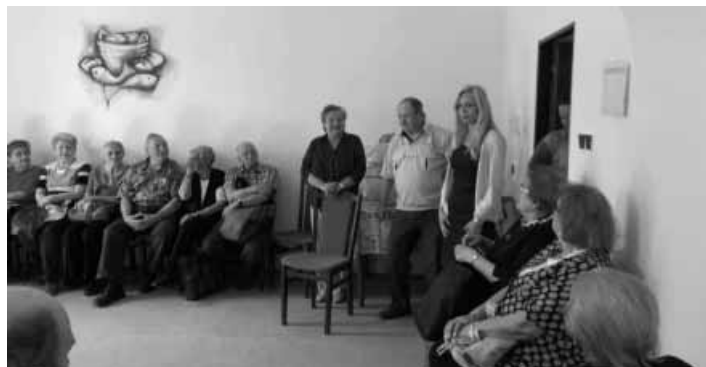
Členovia ÚNSS v DSS