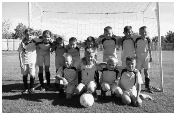
Prípravka FK Sitno BS

V 7. kole sme na deň detí (1.6.) nastúpili opäť na domácej pôde proti futbalistom FK Vyhne.