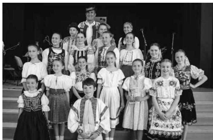
Súťažiaci na spevackej prehliadke ľudových piesní