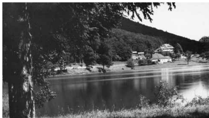
Tajch Počúvadlo

Bola vybudovaná v rokoch 1775-1779, pravdepodobne podľa projektov J. K. Hella. Hlavná hrádza je dlhá 195 m, široká 19 m a vysoká 30 m. Dosahuje vo všetkých vodných nádržích v okolí Banskej Štiavnice nielen najväčšiu výšku, ale je to aj najvyššia hrádza zo všetkých hrádzí, postavených v Európe do konca 18. stor. pre banské účely. Prestavba tejto hrádze sa urobila v roku 1764. Kapacita vodnej nádrže o ploche 12,13 ha