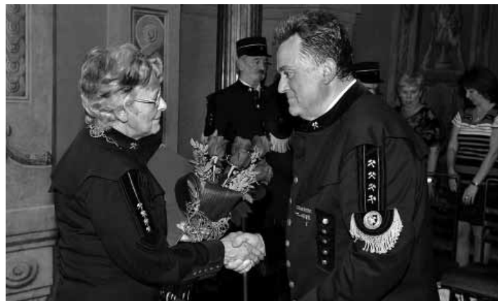
Jubilantovi blahoželá primátorka mesta