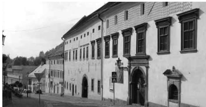
Kammerhof, fotoarchív SBM FOTO KATARINA PATSCHOVÁ

V ďalšom období múzeum prešlo organizačnými zmenami. Patrilo pod priame riadenie ministerstva kultúry, bolo súčasťou Slovenského národ-