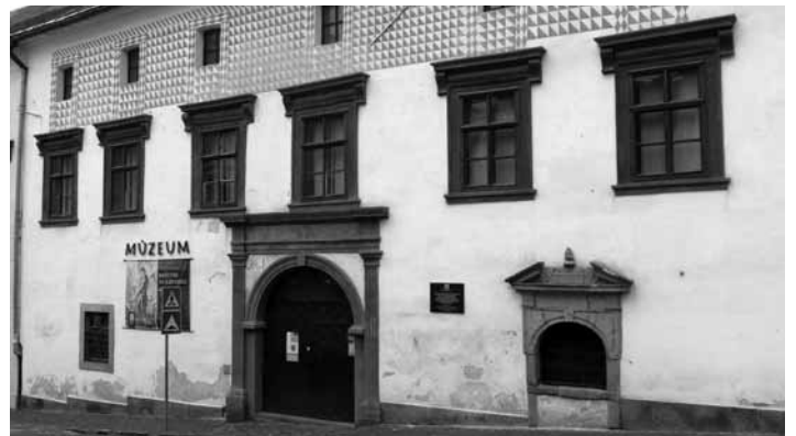
Budova Kammerhofu

Hlavný komorskogrófsky úrad v Banskej Štiavnici riadil banskú, hutnícku, železiarsku, mincovnícku prevádzku, erárne lesy a majetky, školstvo aj zdravotníctvo v celej stre-