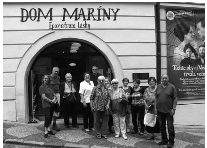
Členovia Jednoty dôchodcov pred Epicentrom lásky

Z Maríninoho domu smerovali kroky členov JDS do neďalekého Evanjelického kostola a.v. (tu bol Sládkovič ordinovaný za kňaza a tu sa vydávala Marína Pischlová), kde si v podaní M. Petrovej vypočuli zaujímavé a menej známe informácie o živote