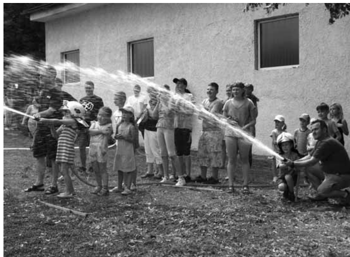
Deti si vyskúšali hasenie z prúdnice