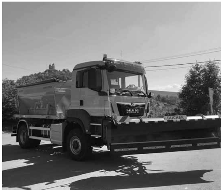
Vozidlo s výmenným systémom

Flotila zimnej údržby mesta má od minulého týždňa novú posilu. Je ňou nový sypač MAN, ktorý bol dodaný vo štvrtok 31.5.2018 na základe verejného obstarávania Mesta BS v celkovej hodnote 214 680€. Vozidlo nahradí, resp. doplní existujúci sypač z r. 2006, ktorý je po niekoľkoročnom intenzívnom nasadení (v lete ako ramenný nakladač) aj pôsobením posypových solí už v dost zlom technickom stave. Kúpa nového vozidla je v celom rozsahu financovaná z rozpočtu