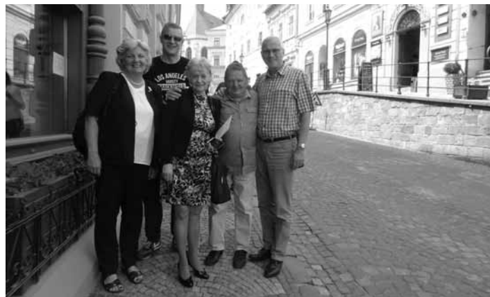
Primátorka mesta s účastníkmi konferencie