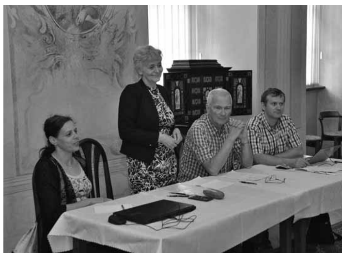
Záverečné zasadnutie konferencie

Konferencia sa konala pod záštitou ministra zahraničných vecí a európskych záležitostí SR Miroslava Lajčáka. Partnerom konferencie bolo Slovenské banské múzeum.