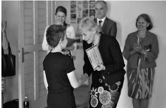
Primátorka odovzdáva diplomy

toru. Súťaž je rozdelená do troch kategórií: do 9 rokov, 10 – 12 rokov a 13 – 15 rokov. Porota vybrala týchto víťazov jednotlivých kategórií a udelila čestné uznania: