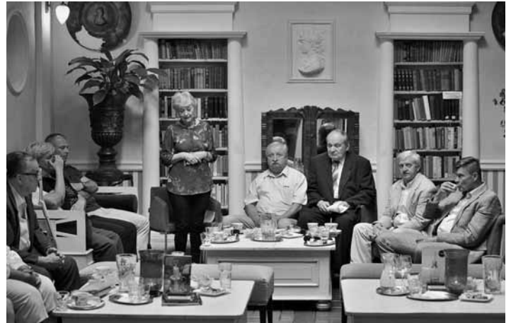
Primátorka nášho mesta pri prejave