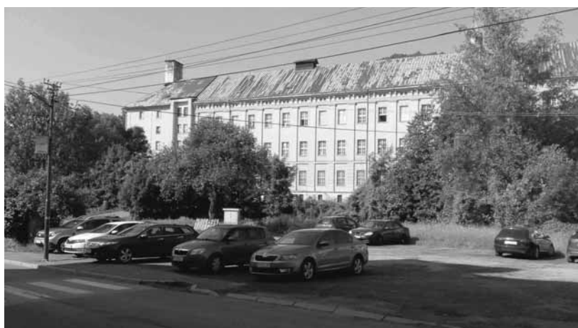
Parkovacia plocha pred "Schindlerkou"