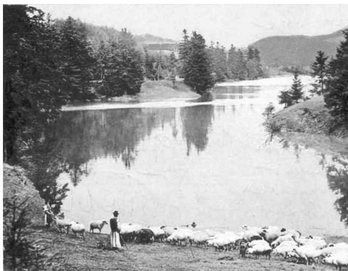
Rozgrund z r. 1743-44 (fotografia je z r. 1912), ktorého zemná hrádza bola až do r.1859 najefektívnejšia a najprogressívnejšia na svete

Viaže sa ku roku 1217, ku obdobiu panovania uhorského panovníka Ondreja II. Listina, ktorá hovorí o príjmoch z Bane – takéto pomenovanie predchádzalo neskoršiemu názvu Banská Štiavnica, bola vyhotovená Uhorskou kráľovskou kanceláriou. Z listiny jednoznačne vyplýva, že už v roku 1217 bola ročná ťažba striebra v Banskej Štiavnici minimálne 600 až 700 kg, čo aj v európskych reláciách znamenalo úctyhodné množstvo. 33.str.