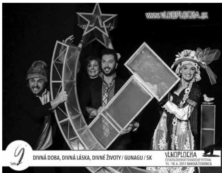
Slovenské divadlo GunaGu