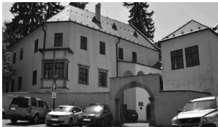
Belházyovský dom, jeden z objektov Baníckej akadémie, v ktorom boli v posledných desaťročiach 18. stor. najchýrenejšie chemické laboratóriá na svete

väčšia, čo sa prejavovalo aj na čoraz väčšej nádhere mesta. Mesto už začiatkom 16. storočia malo až 5 skvostných chrámov, v meste pôsobili svetoznámi majstri maliarskej palety a rezbárskeho dláta. Výnimočné miesto medzi nimi patrilo neznámemu majstrovi zo začiatku 16. storočia, ktorý sa signoval značkou M.S., a ktorého diela patria ku skvostom európskeho neskorogotického umenia. Jednými z nich sú Madona s Ježiškom v Kostole sv. Kataríny, plastiky sv. Barbory a sv. Kataríny v Galérii Jozefa Kollára, obraz Narodenia Pána je v kostole vo Svätom Antone a ďalšie v Ma-