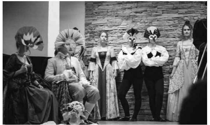
Hudobno-dramatické pásmo žiakov ZUŠ

emocionálny a osobnostný rozvoj má výchova umením, podčiarkli základné umelecké školy v Čechách a na Morave spoločným Dňom otvorených ZUŠ-iek 30. mája. V tento deň vyšli do ulíc, podobne ako my na DOD 29. mája a koncertovali, hrali a tancovali. Jedinečnosť a význam ZUŠ-iek pre vývoj dieťaťa a mladej generácie zdôraznil aj herec a režisér Zdeňek Svěrák výzvou: „ZUŠ-ky celé země, spojte se!“ Z jeho myšlienok na túto tému vyberám: „Já myslím, že ta síť ZUŠek je pro národ, pro tohle obyvatelstvo tak důležitá jako nějaká výživná síť, která zachytí děti v ten pravý čas. A já si hrozně vážím