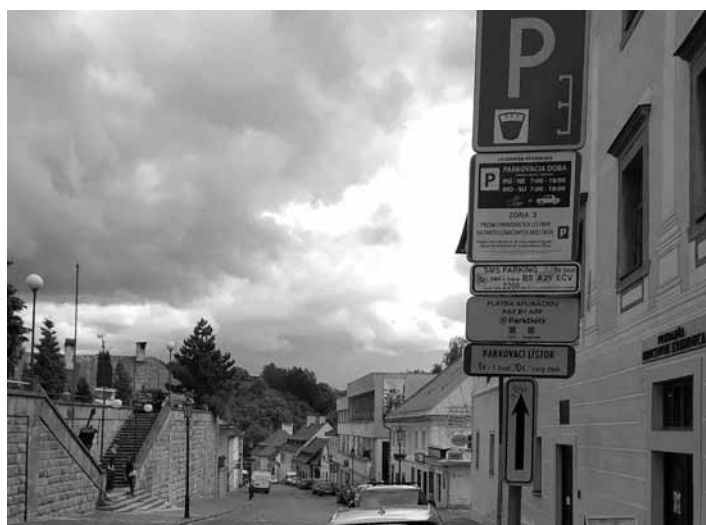
Parkovanie na Kammerhofskej ul.

Úplné znenie nového VZN o parkovaní nájdete na stránke mesta: http://www.banskastiavnica.sk/stranka_data/subory/uradna-tabula/20200511-vzn-202001-o-parkovani.pdf .