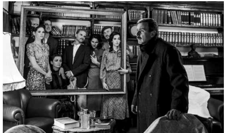
Záber z divadelného predstavenia Kosmopol