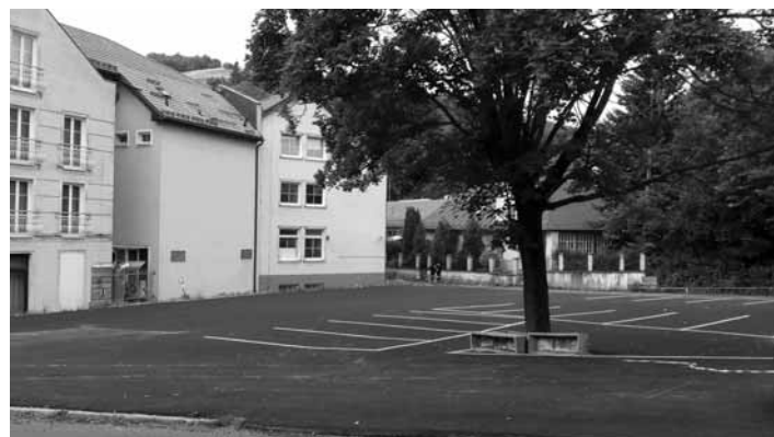
Parkovisko nad Kerlingom