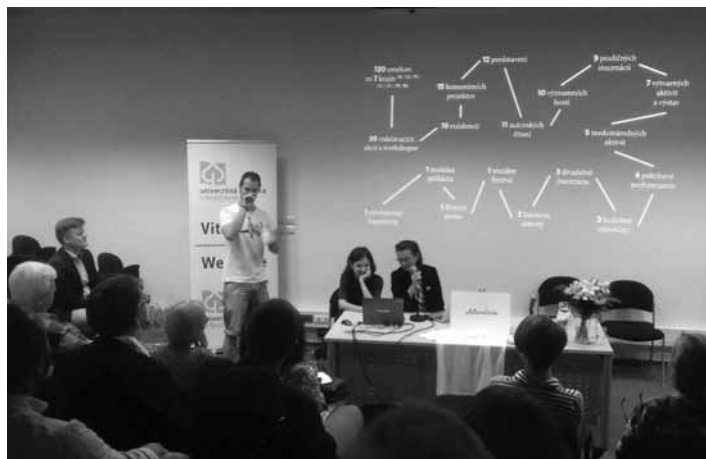
Prezentácia projektu v Bratislave

Vtedy však nereagoval nikto, ale bola som pevne rozhodnutá, že naše mesto sa do tohto projektu musí zapojiť.