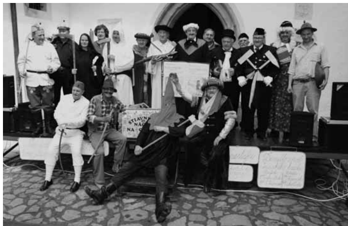
Kolektív banskoštiavnického živého orloja

V rámci festivalového programu vystúpil v sobotu o 12:00 a 14:00 s už tradične veľkým úspechom aj živý banický orloj, ktorý je od roku 2000 pravidelnou súčasťou programu tohto podujatia (s výnimkou rokov 2002, 2009 a 2016). Orloj na spomenutom festivale vystúpil v rokoch: 2000, 2001, 2003, 2004, 2005, 2006, 2007, 2008, 2010, 2011, 2012, 2013, 2014, 2015, 2017 a 2018, teda spolu 16-krát. Jeho vystúpenia sa však (výnimočne) konali aj pri iných príležitostiach. V roku 2000 (1. decembra) v rámci programu osláv venovaných stému výročiu múzejníctva v Banskej Štiavnici (na Starom zámku), počas rozlúčky so starým a pri vítaní Nového roku 2005 (vystúpenie na Námestí sv. Trojice), v roku 2005 počas výjazdu štiavnického Náca (1. apríla 2005 na železničnej stanici vo Zvolene), v júli 2008 a 2011 v rámci programu 5., resp. 8. ročníka Rezbárskeho dňa na Štiavnických Baniach a v júni 2015 vystúpenie orloja doplnilo bohatý program 13. medzinárodného Erbe sympózia (na Starom zámku). Za originálnym banskoštiavnickým živým orlojom stojí kolektív