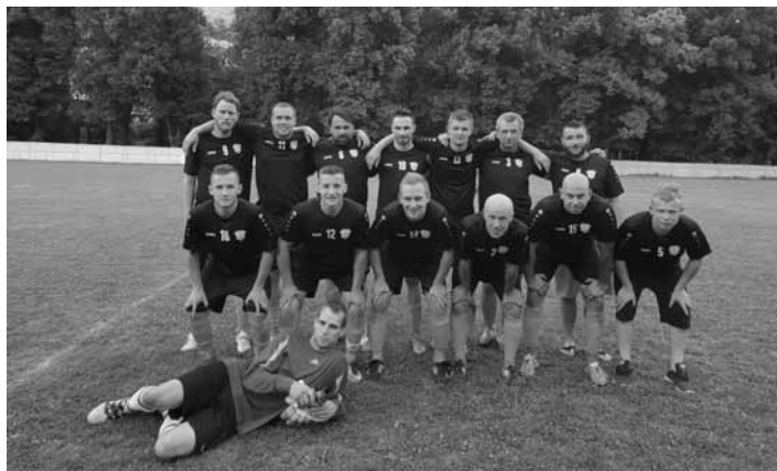
Mužstvo dospelých po zápase v Kremnici

Na svoj posledný zápas sezóny cestovali dorastenci do Kremnice. Chlapci, ktorí končia v dorasteneckom veku, si chceli zápas užiť a zvíťaziť. V prvom polčase sa nič zaujímavé neudialo a gól nepadol. V 2. polčase sa naši prezentovali väčšou aktivitou a gólmi S. Hanusza a M. Galla zvíťazili a do