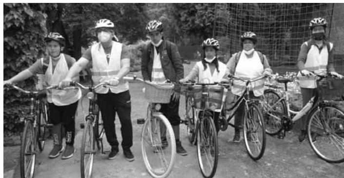
Podpora zdravého životného štýlu

Viacčlenná hodnotiaci komisia, ktorá mala neľahkú úlohu, vybrala a podporila aj cyklo projekt ŠZŠ v Banskej Štiavnici „V sviežom tele zdravá myseľ“. Ako už naznačuje názov projektu, východiskovou situáciou projektového zámeru bolo a aj naďalej je efektívne a podnetné vyučovanie žiakov s mentálnym postihnutím v prostredí prírody podporované zdravým životným štýlom, športom, environmentálnou výchovou, dopravnou výchovou a socializačným progra-