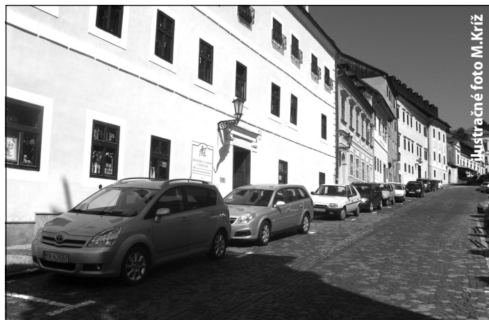
Ilustračné foto M.Kríz

- Permanentné parkovacie karty sa vydávajú na Technických službách, v Klientskom centre na Rad.námestí č.1/A, v Informačnom