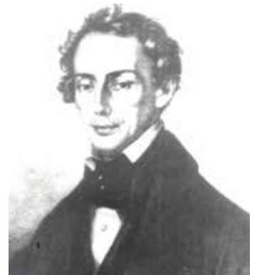
Christian Johann Doppler

ských vedeckých periodikách. Napísal aj viaceré vedecké publikácie. Najväčší význam mala jeho štúdiá Über das farbige Licht der Doppelsterne (O farebnom svetle dvojhviezd). V tejto štúdiu sa prvý raz na svete zaoberal javmi, ktoré vznikajú pri pohybe telesa, ktoré je súčasne zdrojom zvuku alebo svetla a pri vnímaní týchto zvukových alebo svetelných signálov pozorovateľom. Ak sa zdroj zvuku približuje, pozorovateľ vníma kmitočet vyšší a ak sa vzdaluje, vníma kmitočet nižší ako je kmitočet zdroja. Podľa Dopplera je to podobne aj pri pohybe pozorovateľa voči zdroju zvuku, ktorý je v pokoji. Tento princíp platí i pre optické javy. Doppler tak položil základy princípu, ktorý sa dodnes nazýva podľa neho a vo fyzike je známy ako