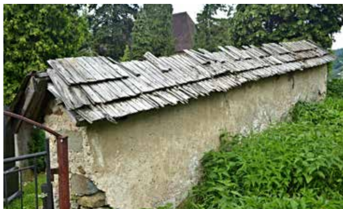
Poškodený ohradový múr a drevený šindel'

Realizáciou rekonštrukcie ohradového múru sa zlepši stavebno-technický stav ďalšej národnej kultúrnej pamiatky v meste Banská Štiavnica