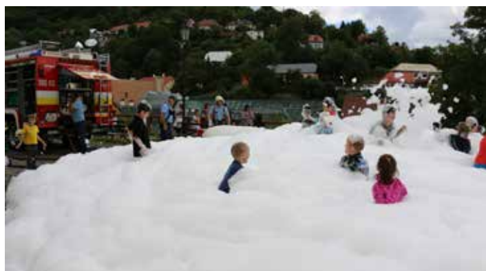
Penová šou na Starom zámku