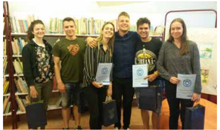
Ocenení študenti