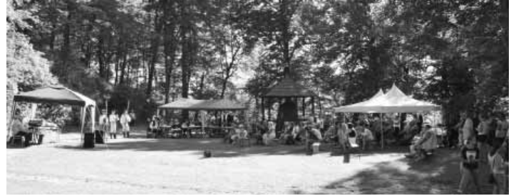
Kaštielsky park za jazierkom pri jaskyni