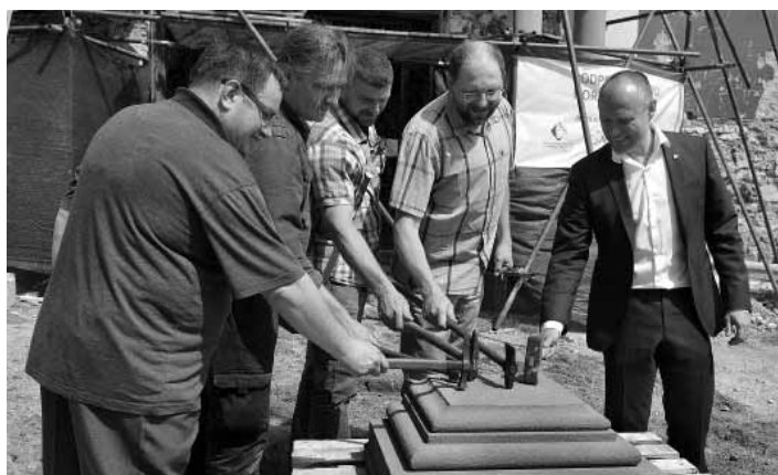
Započatie obnovy Horného kostola Kalvárie

Dnes už je Horný kostol čiastočne zahalený lešením. Okrem fresiek a por-