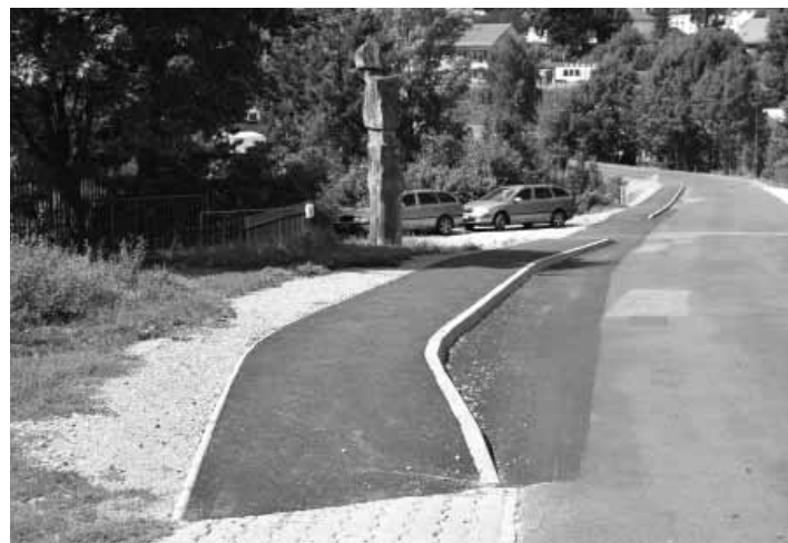
Novovybudovaný chodník k školskému areálu

Zhotoviteľom a realizátorom stavby bola na základe uskutočneného verejného obstarávania stavebná firma Strabag, s.r.o. Bratislava. Realizácia stavebných prác pozostávala z vybudovania nového chodníka v šírke 1,5 m, v dĺžke cca 223 m vedľa komunikácie v náročnom a svahovitom teréne. V rámci chodníka bolo na niektorých jeho častiach vybudované aj ochranné oceľové zábradlie. Celková cena diela predstavuje finančnú čiastku 58 758,29 EUR, ktorá vyšla z procesu verejného obstarávania. Snahu o vybudovanie uvedeného chodníka vyvíjalo Mesto najskôr v spolupráci s Banskobystrickým sa-