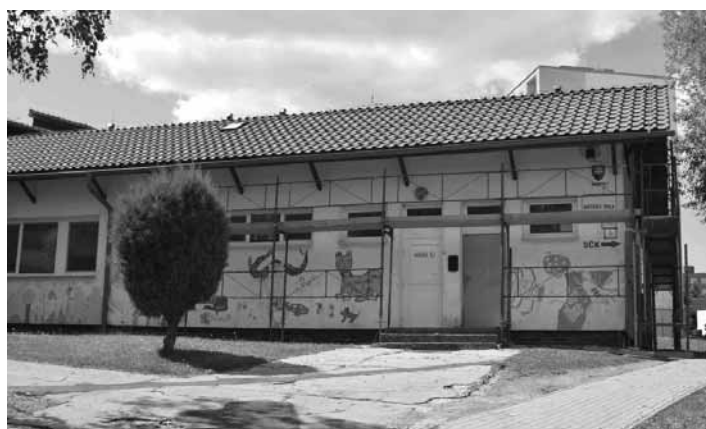
Materská škola na Ul. bratská