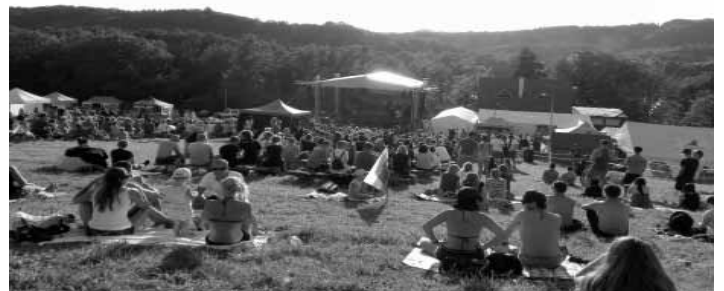
Zaplnený amfiteáter Počúvadla