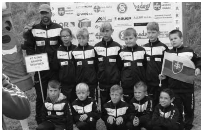
Futbalisti prípravky v Trnávke

V sobotu nás čakali prvé štyri zápasy v skupine, v nedeľu ďalšie dva. V prvom zápase sme pôsobili zaspáťým dojemom, súper z Brna bol jednoznačne lepší vo všetkých činnostiach, čomu sme prispeli aj my našou pomalou hrou. Do druhého zápasu sme už nastúpili prebudení, čo sa odzrkadlilo aj na hre a samozrejme aj výsledku. V treťom zápase sme nadviazali na výkony z predošlého stretnutia, avšak gólovo sa nepresadilo ani jedno mužstvo, nakoľko brankári dominovali. V štvrtom stretnutí sme sa stretli s najslabším tímom v skupine, kde sme dali