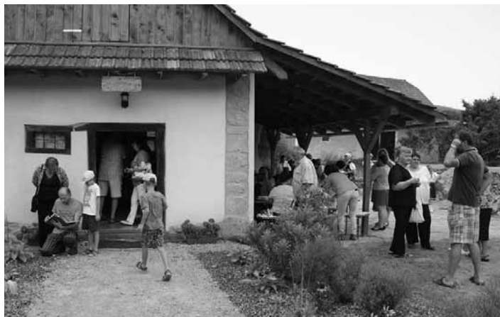
Otvorenie obecného múzea

K jeho vzniku viedla dlhá a zaujímavá cesta. Začalo sa to v roku 2015, keď obecný úrad odkúpil od súkromnej osoby starú hospodársku budovu – pajtu. Bola v dosť dezolátnom stave a názory na jej využitie sa rôznili. Uskutočnil sa preto verejný prieskum, aby sa mohli ľudia z obce vyjadriť, ako nehnuteľnosť využiť. Objavil sa aj názor, že budovu by bolo najlepšie zbúrať... Ale nestalo sa. Vďaka veľkému úsi-