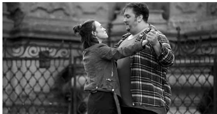
Záber z filmu Úlet pri súsoší sv. Trojice