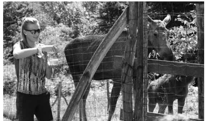
Nasť Kuzmina pri krste losičaťa

V nedeľu 12. augusta tam trojnásobná olympijská víťazka Anastasia Kuzmina pokrstila losičatko, ktoré sa narodilo 16. mája 2018 a počas týchto dní bolo oficiálne predstavené verejnosti. Losičatko dostalo meno Helga a narodila sa mamičke Gigi. Nastenka Kuzmina v krátkom príhovore okrem iného spomenula, že tu na Slovensku ide o vzácnny druh, no v oblasti, z ktorej pochádza je los bežným druhom žijúcim vo voľnej prírode. Múzeum vo Svätom Antone úspešne spolupracuje s revištským Zveroparkom a taktiež sme mali možnosť už v kaštieli pri-