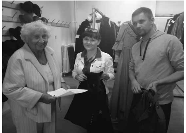
Organizačný tím v šatnici

Keďže som mala ťažkosti so zabezpečením somára, darovala som ho Salamandru. Podobne som potrebovala aušusnícke biele uniformy, darovala som látku na ich ušitie. Čiže hľadala som finančné prostriedky tak, aby MsÚ táto akcia čo najmenej zaťažovala. Moja snaha bola korunovaná úspechom. Dnes môžem prehlásiť, že máme vybudovanú šatnicu pre viac ako 400 ľudí. Nachádza sa tu viac ako 2000ks ošatenia vrátane obuvi. Ďalšia veľmi ná-