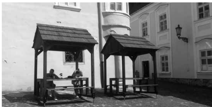
Nové stánky lokálnych umelcov a remeselníkov

Na zabezpečení predajného miesta sa partnersky podieľalo aj Mesto Banská Štiavnica, ktoré poskytlo pre stánky exkluzívne miesto a OZ Umenie a remeslá Štiavnice, ktoré zabezpečí a garantuje predaj počas hlavnej turistickú sezóny. Keď počasie predaj znemožní, stánky z námestia zmiznú.