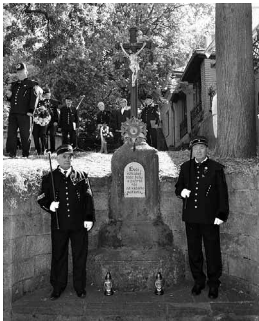
Vzdanie úcty