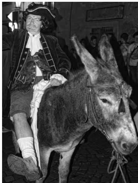
Salamandrový somárík