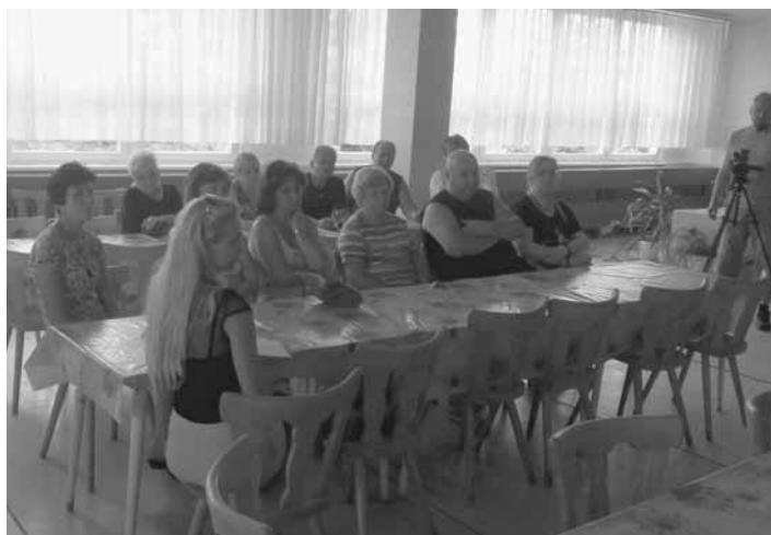
Obyvatelia sídl. Drieňová v jedálni