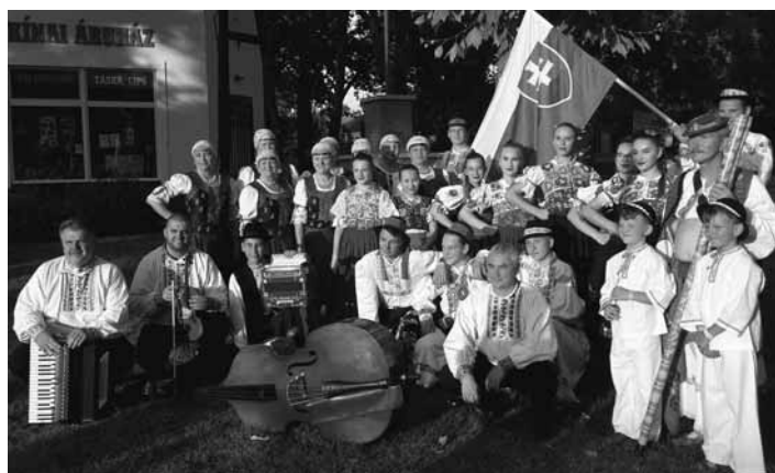
Folklorný súbor Podhorčan s hosťami

Festival v Makó má úplne inú filozofiu a koncepciu, než festivaly, ktoré poznáme u nás. Festival trvá niekoľko týždňov a v každom týždni sa striedali súbory z celej Európy. V júli a auguste tam napríklad účinkovali súbory z Česka, Belgicka, Švajčiarska, Estónska, Španielska, Talianska, Portugalska. V turnuse 8. – 13.8.2018 sa na festivale zúčastnili nasledovné súbory: Orawskie Dzieci z Lipnica Wielka – Poľsko, Kultúrno-umelecká spoločnosť Kolo z Koper – Slovinsko,