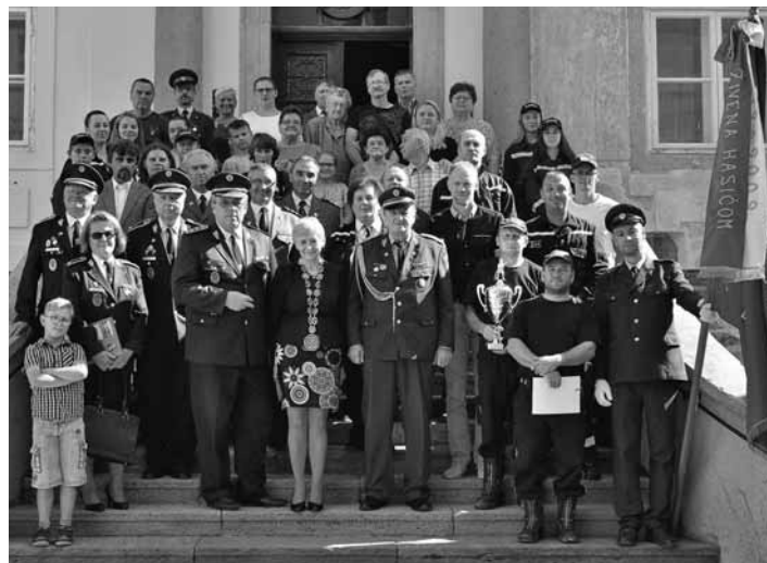
Členovia DHZ a pozvaní hostia pred radnicou