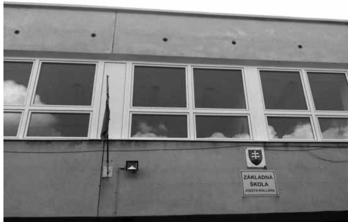
Výmena okenných zostáv

Práce boli vykonané v nasledovnom rozsahu: demontáž starých drevených okenných rámov, dodávka a montáž nových okenných zostáv a dverí, murárske vysprávky stien a ostení, vonkajšie a vnútorné parapety, maliarske vysprávky, likvidácia a odvoz starých