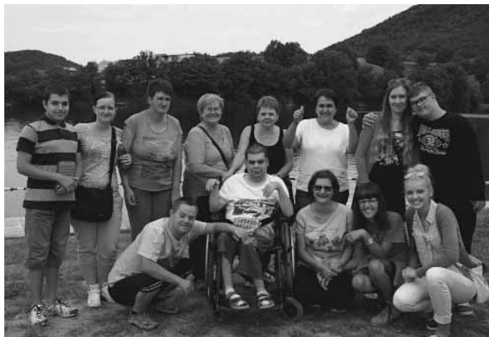
Klienti denného stacionára pri tajchu

Deň otvorených dverí sa bude konať v rámci celoslovenskej akcie - Týždeň dobrovoľníctva, ktorá prebieha od 16.9. do 22.9.2016. Počas dňa otvorených dverí máš príleži-