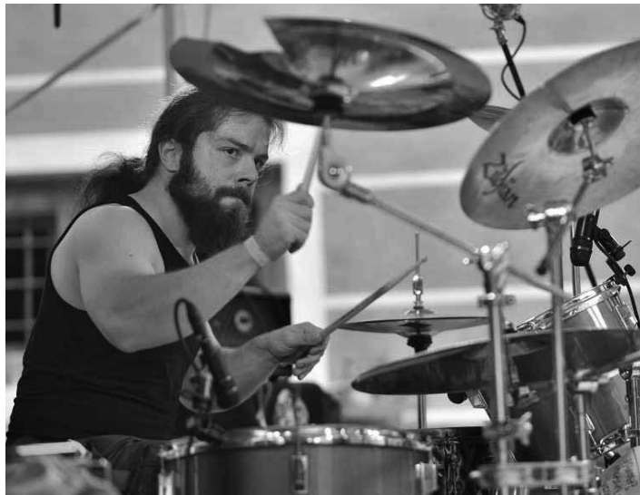
Účinkujúci na charitatívnom podujatí