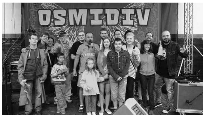
Margarétky obdarovali účinkujúcich hostí