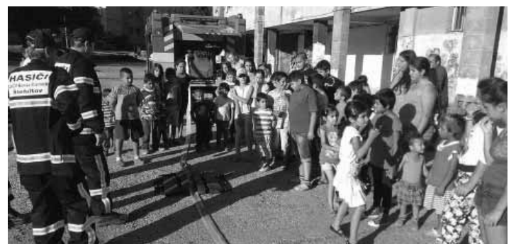
Hasiči DHZ Banská Štiavnica-Štefultov na Šobove