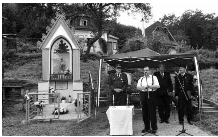
Príhovor pána farára Frindta