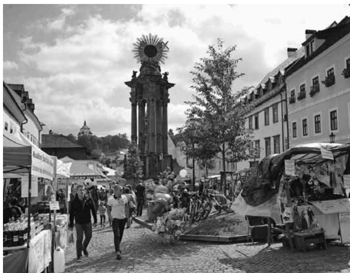
Salamandrové námestie

Rozhodnú o tom svojim správaním ich samotní návštevníci. My sme sa snažili aj v tomto roku pripraviť program, ktorý poteší rôzne vekové kategórie, milovníkov rôznych hudobných žánrov i deti. Piatkový program začne pred 15.00 hod. a vystúpia v ňom až tri štiavnické hudobné zoskupenia. Najprv to bude jazzovo – rockový Nácov kufor, neskôr sa k nemu pridá hip – hopová trojica Wuashica, Rusta a Pati B. a ako posledný z tejto trojky vystúpia rockeri zo skupiny +-40. Tešíme sa na to,