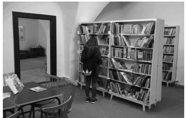
Knižnica sídli v budove Rubigallu