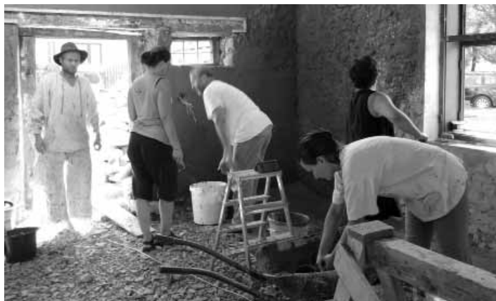
Z bývalej pajty bude obecné múzeum

Prečo práve Beluj? No preto, že obec odkúpila starú pajtu, v ktorej by malo byť v budúcnosti obecné múzeum. Pajta už bola samozrejme značne poznačená vekom, tak ju bolo treba opäť prebudovať k životu. A keďže má byť dôstojným prístreškom pre staré zachované predmety hmotnej kultúry, bolo logické, že aj jej úprava by mala zodpovedať tomuto účelu. S realizáciou tohto projektu pomohlo obci OZ ArtTUR, ktoré sa zameriava na ekologické stavebníctvo a šetrný prístup k starej architektúre. Pri práci na pajte sa tak stretli nielen absol-