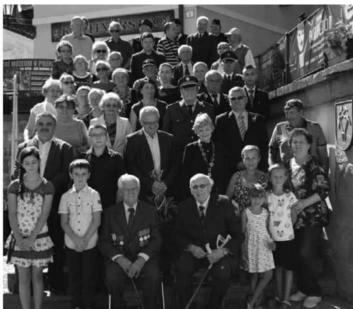
Účastníci spomienkových osláv

Stretli sme sa, aby sme vzdali hold všetkým tým, ktorí sa ho zúčastnili a venovali spomienku tým, ktorí v tomto boji stratili svoje životy. SNP je významnou udalosťou nášho národa, keď so zbraňou v ruke národ povstal proti nacistickým okupantom, rozhodnutý brániť svoju krajinu a svoju slobodu. Ľudia