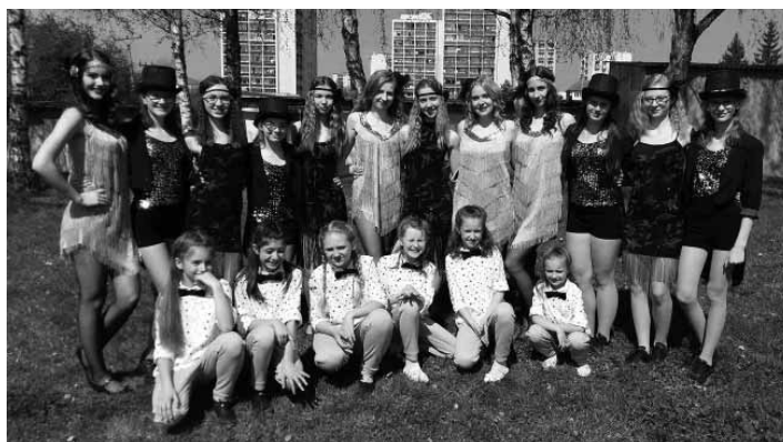
Tanečná skupina Applause

Sebaobrana – od 13. – 15. rokov, zápis 5. 9. a 12. 9. 2017 /utorok/ od