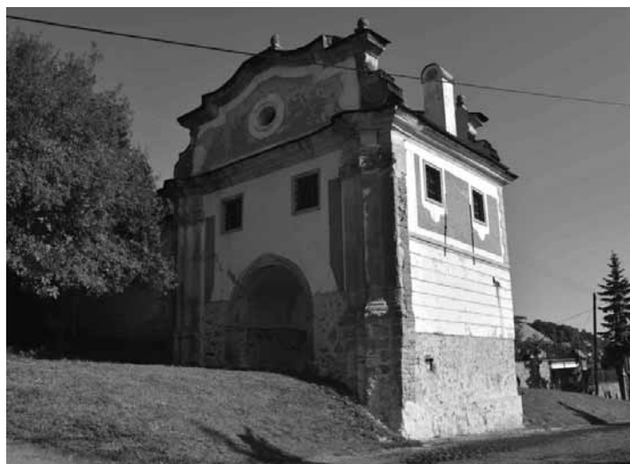
Piarska brána

Pôvodné mestské opevnenie zostávalo z dvojnásobného venca opevnenia, ktorý bol vytvorený pospájaním obvodových murív jednotlivých domov.