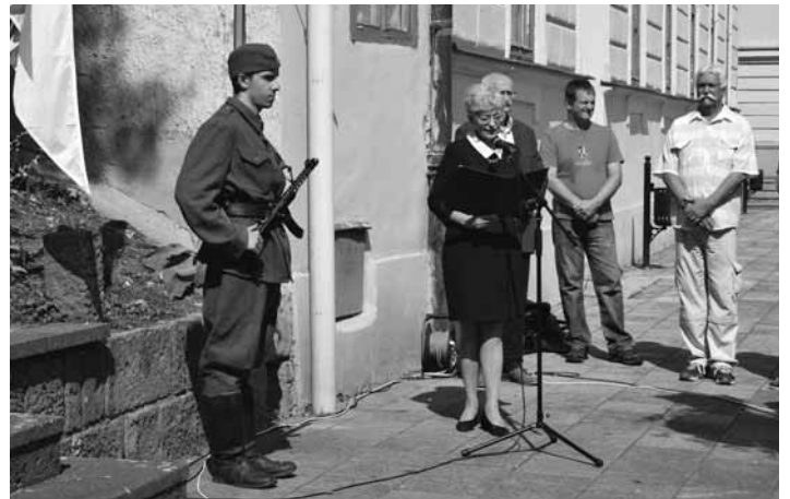
Slávnostný prejav pri pomníku SNP

Pamäť každého z nás, ale najmä tá národná pamäť, je základnou podmienkou existencie každého národa. My, Slováci, si nesmierne vážime a pripomíname všetko, čo nás posunulo dopredu, čo nás zušľachtilo a posilnilo. Slovenské národné povstanie je takýmto medzníkom a som rada, že dodnes je našou živou pamäťou. V spomienkach naň, v hodnotení jeho prínosov sa prelínajú úcta k minulosti, ale aj zodpovednosť za budúcnosť. Ak by to