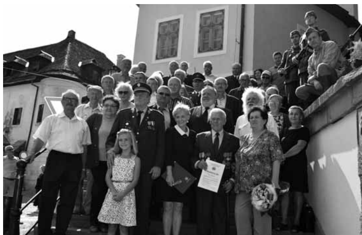
Účastníci spomienkových osláv