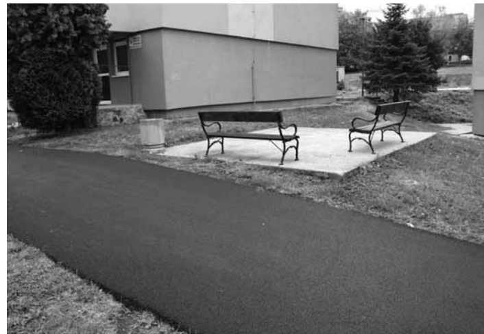
Nový chodník a lavičky na ul. Energetikov

Mesto Banská Štiavnica Vás srdečne pozýva na vernisáž výstavy