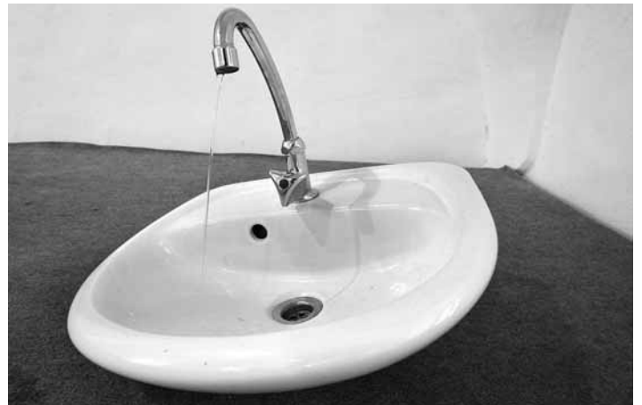
Výstavný exponát