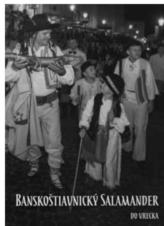
BANSKOŠTIAVNICKÝ SALAMANDER DO VREČKA

Banská Štiavnica a technické pamiatky okolia Evropské dedičstvo od roku 1993