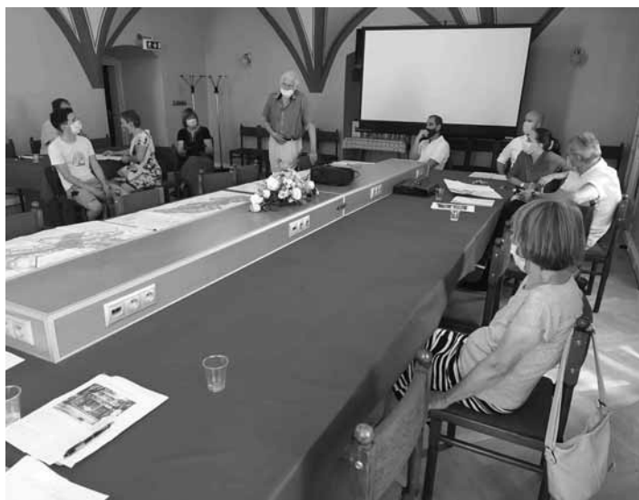
Prezentácia návrhov v zasedačke MsÚ

námiť s návrhom riešenia územného plánu zóny Pamiatkovej rezervácie, časti historického jadra Banská