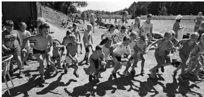
Preteky na Klingeri