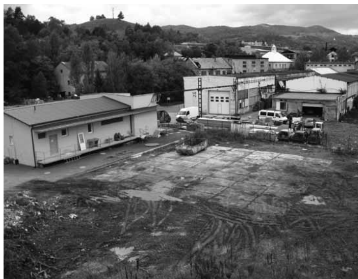
Miesto na zbernom dvore pre kompostáreň

Kompostáreň nie je zložitá stavba, betonáže a mokré procesy by sa mali stihnúť do príchodu zimného počasia. Celá stavba bude dokončená do 6 mesiacov, plánovaný termín spustenia kompostárne do prevádzky je marec