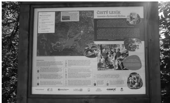
Informačná tabuľa na Klingerí

Od začiatku školského roku 2015/2016 sa škola zapojila do medzinárodného programu Zelená škola, ktorý je najväčším výchovno-vzdelávacím programom v oblasti environmentálnej výchovy na svete. Podľa metodiky Zelené školy a v spolupráci s pracovníkmi neziskovej organizácie Živica a za podpory Mesta Banská Štiavnica vy-