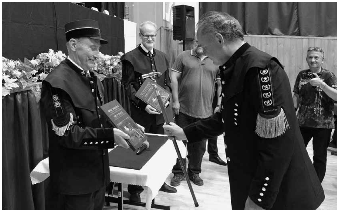
Prezident SR Andrej Kiska poklepaním fokošom uvítal knihu do života