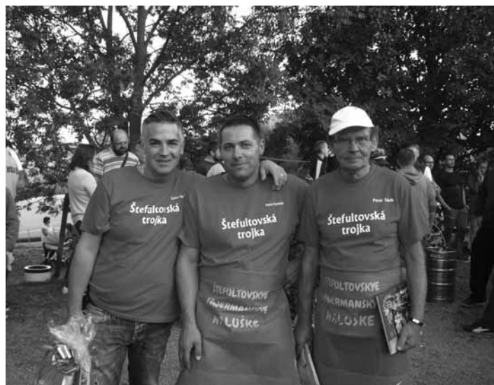
Vítané družstvo 1. ročníka

dili. Najviac sa varili bryndzové halušky na rôzne spôsoby. Väčšinou doplnené pažitkou, smotanou, slaninou, rôznymi kľúčkami, kyslou alebo sladkou kapustou, klobásou, syrom. Ale našli sa aj iné druhy, ako kalerábové či bezlepkové. Dokonca v poslednom prípade nám súťažiaca prezradila, že všetky ingrediencie sú z ich vlastnej biofarmy. Použité recepty boli súčasné, ale aj od starých a prastarých mám. Všetky chutili výborne a 5 – členná porota v zložení: zástupca mesta, zástupca VUC BBSK, štatutárka OZ Majulienka, členka DHZ Štefultov a zástupca za hotelovú gastronómiu rozhodli takto: 3.miesto HaZZ B. Štiavnica, 2.miesto SKI Dúbravy, 1.miesto Štefultovská trojka. Cenu Štefultova, v ktorej hlasovalo 42 ľudí, získali Tatranskyye ovce a cenu za originalitu DJ Žulo a kamaráti za svoje super kalerábové haluštičky. Všetci víťazi dostali vecné odmeny a všetci súťažiaci zároveň aj milé upomienkové predmety. Podujatie doplnili rôzne sprievodné akcie. K dobrej nálahe hral fujařista, gajdoš a heligónkar. Ďalej to bola súťaž v jedení 0,5 m syrovej nite pre deti a 1 m pre dospelých.