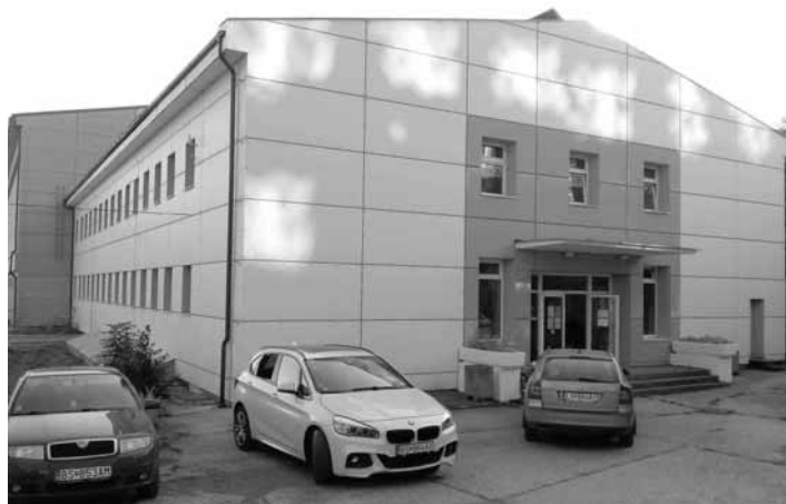
Mestské kúpele – plaváreň

Bytová správa, s.r.o., zabezpečuje prevádzku kúpeľov – plavárne a sauny od roku 2009. Prevádzka je od tohto dátumu otvorená 10 mesiacov v kalendárnom roku. Mesto vyčlenilo v rozpočte na opravy a re-