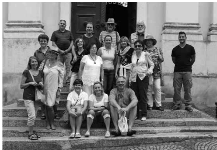
Umelci pred evanjelickým chrámom