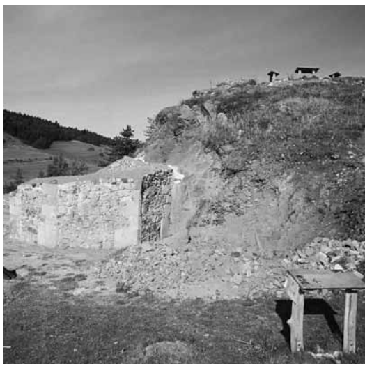
Skúmaný areál Hradnej kaplnky

Tu zároveň prebiehali konzervačné práce fortifikačných a obytných architektúr. Archeologická sonda bola situovaná v miestach predpokladanej brány do hradu v južnej časti lokality. Výsledkom výskumu nebol síce objav murovaných základov brány, ale veľké množstvo veľkých i menších fragmentov kamenných článkov. Ich tvar a veľkosť jednoznačne naznačujú, že boli použité v murovanej architektúre (nález maltoviny) brány. Počas existencie hradu Glanzenberg tu existovalo viacero hlavných i vedľajších brán, ale aj sedem doteraz odkrytých bráničiek na rôznych miestach hradby, ktoré zabezpečovali jednoduchý styk s obyvateľmi pod hradom.