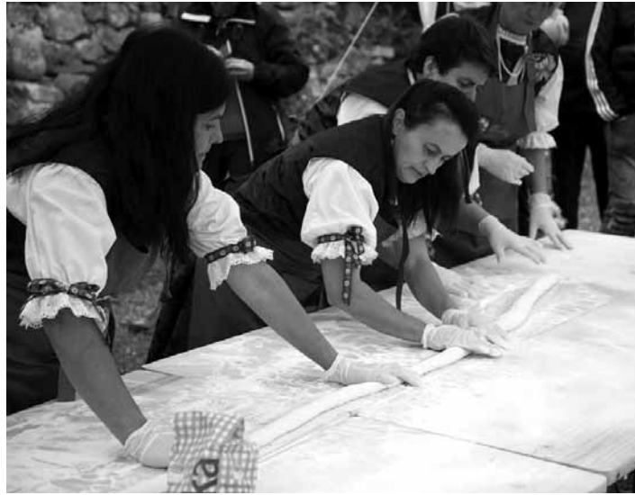
Príprava belujského šúlanca