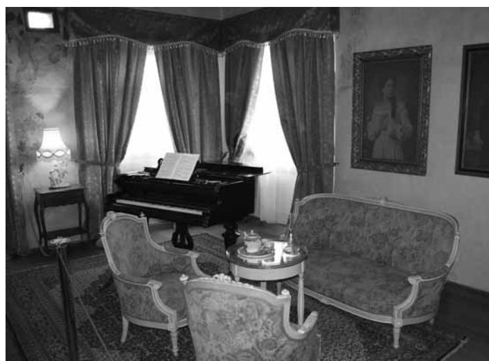
Interiér Epicentra Lásky