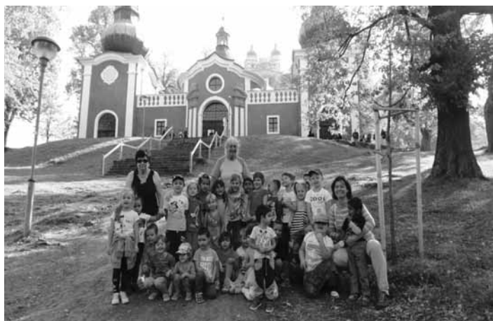
Františkove slniečka pod Kalváriou