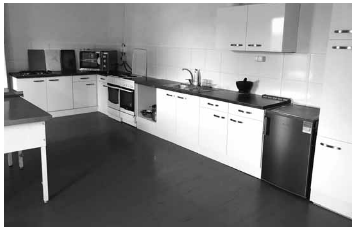
Moderná učebňa prípravy pokrmov

Počas prázdnin prebiehali intenzívne rekonštrukcie a študentov tak privítala nová alma mater. Vymenené okná, zrekonštruované a zateplené schodisko urobilo dojem, že budova omladla a opeknela. Získala nový moderný ráz nielen z hľadiska exteriéru. Mnoho sa zmenilo aj v interiéri. Študentov čakala nová reštaurácia s francúzskymi oknami, ktoré celé prostredie otvorili a vyčarili novú scenériu prepojenú s prírodou. Ďalšou zmenou je moderná učebňa technológie prípravy pokrmov. Veľkoryso riešená cvičná kuchyňa prepojená s novou reštauracnou časťou, určenou len pre výučbu, dáva študentom priestor nielen pre prípravu jedál, ale aj pre ich servírovanie a konzumáciu. Môžeme si položiť otázku, prečo? Veď variť sa dalo aj v pôvodnej. Možno áno, ale ak chceme vychovať v študentoch lásku k profesii, ktorú budú vykonávať, estetické cítenie a tvorivú kreativitu pri prá-