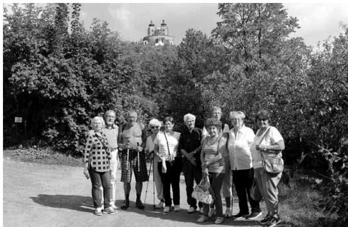
Členovia Jednoty dôchodcov Slovenska

No a na túto dominantu mesta sa v jeden slnečný septembrový deň rozhodlo vystúpiť 11 členov miestnej Jednoty dôchodcov Slovenska. Výzvou nebol len turistický zážitok, ale i odhodlanie na vlastné oči vidieť reštaurátorov, murárov, remeselníkov pri práci. Pozorovať ich na naj-