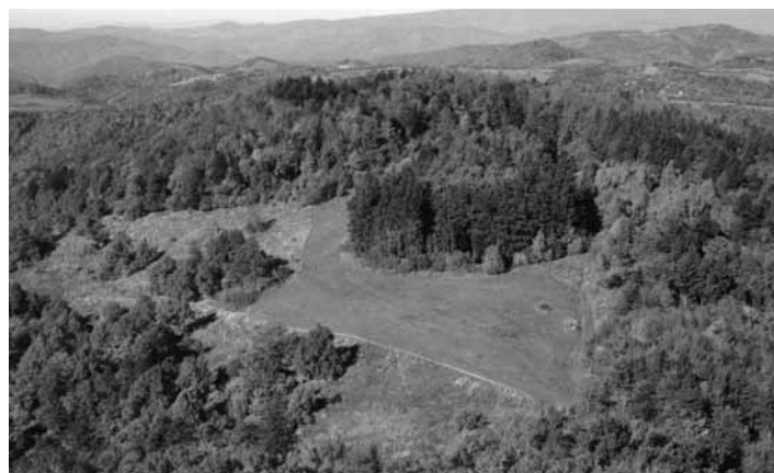
Vysadený pamätný háj

Napriek času, ktorý nás od jej konca delí, dodnes žijeme víťazstvom, ktoré sme vtedy dosiahli. Vďaka nemu čítate tento článok v tomto jazyku. Zatiaľ ním môžeme hovoriť, vyučovať, úradovať... Tak ako sa jeho zánik pomaly blíži, tak bol pomalý jeho nástup. Banská Štiavnica si na zánik Baníckej a lesníckej akadémie spomína odchodom školy do Šoprone a odvezením všetkým cenných zbierok. Len málo sa podarilo „zachrániť“. Začali sme budovať „svoje“ odznova tak, ako sme to odvtedy urobili už niekoľkokrát. Našli sa (a nachádzajú) takí, čo nevideli v Československej republike budúcnosť. Napriek všetkému sme prežili a oslavujeme storočie nezávislosti od Rakúsko – Uhorska. Malé dieťa sa teší na každé ďalšie narodeniny, tí starší ich už prechádzajú bez povšimnutia. Aj mladá, Československá republika sa tešila na svo-