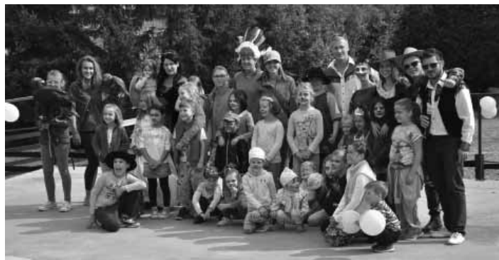
Účastníci westernových pretekov

Rodina Binderová a Durbáková tak vdýchla tomuto miestu nový šat a deti sa popri koníkoch mohli tešiť aj niečomu inému. Rodičov s deťmi prišlo neúrekom. Akcia, ktorá niesla oficiálny názov Westernový ranč, sa začala od 10:00 hodiny detskými a juniorskými westernovými pretekmi, ktorých sa zúčastnili deti do 12 rokov. Víťazi boli ocenení stužkami. Už od tejto chvíle však paralelne bežali aj súťaže ako: Lukostreľba, maľba na tvár, beh cez prekážky, skok v mechu, preťahovanie s lanom pod vede-