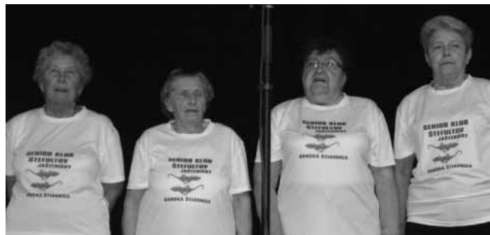
Členky Senior klubu Štefultov-Jašteričky

A keďže sa tohto ročníka Seniorského talentária zúčastnilo rekordných 132 účinkujúcich, museli organizátori kinosálu, kde sa táto nesúťažná prehliadka záujmovo-umeleckej činnosti seniorov doteraz konala, vymeniť za veľkú sálu Kultúrneho centra, ktorá sa vo štvrtok 22.9.2016 dopoludnia zaplnila účinkujúcimi aj divákmi nielen z Banskej Štiavnice a okolia, ale aj z miest a obcí, odkiaľ k nám účinkujúci pricestovali (Levice, Žembovice, Zvolen, Hodruša-Hámre, Pukanec...). Podujatie sa už každoročne koná pod záštitou primátorky Mesta Banská Štiavnica a keďže v tento deň bola pani primátorka služobne mimo Banskej Štiavnice, prítomných pozdravila za MsÚ Bc. Eva Gregáňová. V dvaapohodinovom programe účinkovalo 8 súborov (a to sme ešte dva súbory s ťažkým srdcom museli odriecť) a 11 sólistov. Boli to: spevácka skupina Úsmev z Banskej Štiavnice, spevácky súbor Žemberovčan, spevokol Senior z Hodruše – Hámrov, spevácko-tanečný súbor Jašteričky