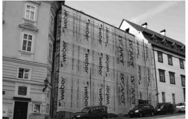
Práce na novej fasáde Rubigallu sa začali

Konkrétne na obnove čelnej a zadnej fasády, ktoré sú hradené prevažne z prostriedkov štátneho rozpočtu prostredníctvom Ministerstva kultúry Slovenskej republiky, ale aj z vlastných prostriedkov mesta. Na časti čelnej fasády t.j. od Nám. sv. Trojice prebiehajú reštaurátorské práce a práce na výmene klampiarskych prvkov. Vzhľadom na nedostatok finančných prostriedkov práce budú v tomto roku ukončené len vo vrchnej časti fasády a to bez farebnej povrchovej úpravy, ktorá bude prevedená až po celkovej obnove fasády. Na zadnej fasáde t.j. od schodišťa pod Starým zámkom prebiehajú práce na obnove fasády, pozostávajúce z opráv omietok, opráv dreveného