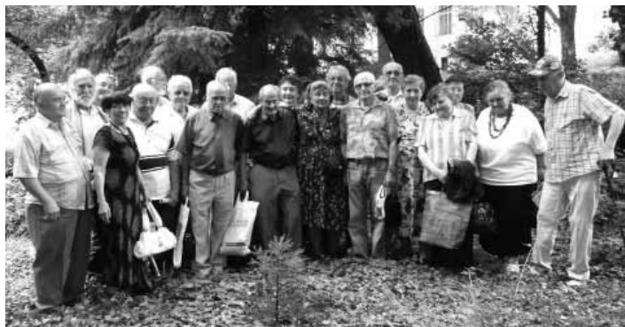
Absolventi školy v botanickej záhrade