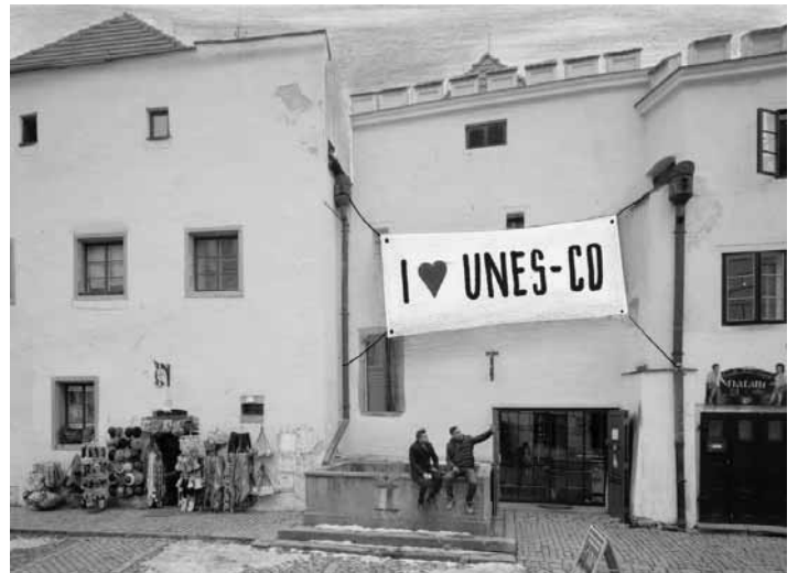
Projekt UNES-CO

tervencií pretvára na Londýn a 3. UNES-CO – projekt pre 16. Biennale architektúry v Benátkach, v ktorom zamestnáva bežných ľudí a ponúka im ubytovanie a plat za to, že žijú normálny život. Pokúša sa riešiť zdanlivo neriešiteľný problém drastického vysídľovania miest zapísaných na zozname kultúrneho dedičstva UNESCO. Pôvodní obyvatelia tu žiť nechcú alebo nemôžu. Ich domovy sa postupne pretvárajú na akýsi skanzen, permanentne okupovaný a zaplavovaný davmi turistov. Tí