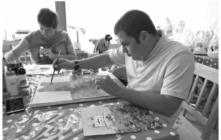
Klienti Denného stacionára Margarétka

No v dnešnom uponáhľanom živote, akoby sme zabúdali na úplne prirodzenú kreativitu, ktorá vyjadruje naše pocity a emócie. Každý si nesie svoj batoh starostí a blokov, no konkrétne sebapoznávacie techniky dokážu prebudiť naše driemajúce vnútorné dieťa. Aj my v sociálnom zariadení Denný stacionár Margarétka pre telesne a mentálne postihnutých mladých ľudí arteterapiou podporujeme liečbu našej duše tak, aby sme pomohli odblokovať rokmi nadobudnuté strachy a emócie. Klienti sa tešia na dni, keď položia pred seba čistý papier, farbičky a začnú kresliť len tak voľne a potom to dielo je prekrásne a pociť samostatnosti vzrastie. Využívame skupinovú aj samostatnú prácu, čím sa podporuje individualita človeka, jeho schopnosť prejavovať sa v kolektíve. Arteterapia má veľký sociálny