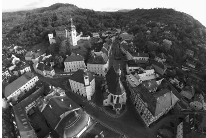
Panoráma Banskej Štiavnice

Po dobrých skúsenostiach vo výuke anglického jazyka hrovou formou sme sa rozhodli začleniť do ponuky pre deti aj krúžok nemeckého jazyka. Nadväzujeme tak na projekt Škola budúcnosti, ktorý bol v škole realizovaný v rokoch 2004 – 2007.