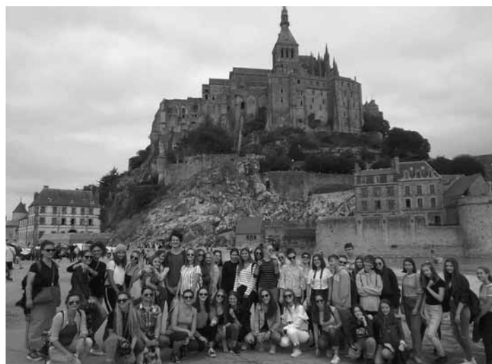
Študenti Gymnázia A. Kmeťa v Paríži

Ďalší deň náš autobus zaparkoval neďaleko francúzskeho žulového ostrova (resp. polostrova) Le Mont-Saint-Michel na pobreží Normandie. Išlo o „plávajúce“ opátstvo. Na ostrov vedie iba jediná cesta – po hrádza. Je obklopený tekutými pieskami a zradným bahnom. Ostrov poznali už Kelti, v ich mytológii sa píše aj o akomsi morskom hrobe, kam odchádzali duše ich mŕtvych. Podľa stredovekej legendy sa biskupovi Aubertovi zjavil archanjel Mi-