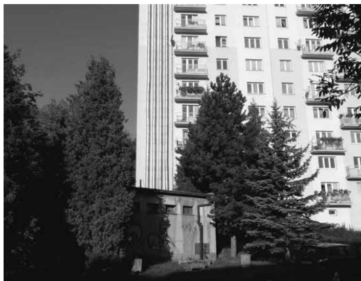
Kotolňa Kz na Dolnej ulici

„Dodávať teplo do bytov sme začali v pondelok 24. septembra. Podľa vyhlášky ministerstva hospodárstva je výrobca tepla povinný začať dodávku tepla vtedy, ak priemerná denná teplota dva dni po sebe klesne pod 13 stupňov a nie je predpoklad, že táto teplota sa zvýši.