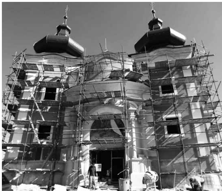
Rekonštrukcia Horného kostola

Pri tejto príležitosti Vás srdečne pozývame na slávnostné podujatie, ktoré sa uskutoční v piatok 12. októbra . Podujatie má dve časti. Začína o 15:30 na Hornom kostole jeho slávnostným otvorením, potom sa presúva do kultúrneho centra mesta so začiatkom o 18:00. Na večerný