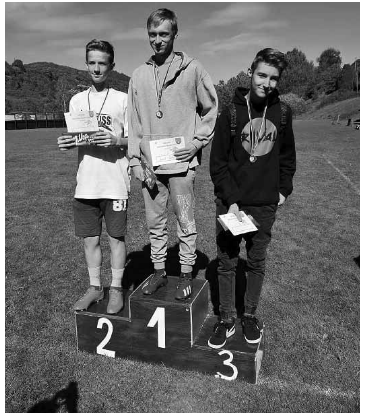
Žiaci na stupňoch víťazov

Po vyhlásení najmenších víťazov pokračovali preteky ďalšou kategóriou žiakov a žiačok prvého stupňa. Súťažili medzi sebou spolužiaci vo všetkých ročníkoch. Ako prvé sa na štartovaciu čiaru postavili prváčky a s veľkou chuťou a elánom po štartovacím signáli vybehli k cieľu. Víťazmi v kategóriách 1. stupňa