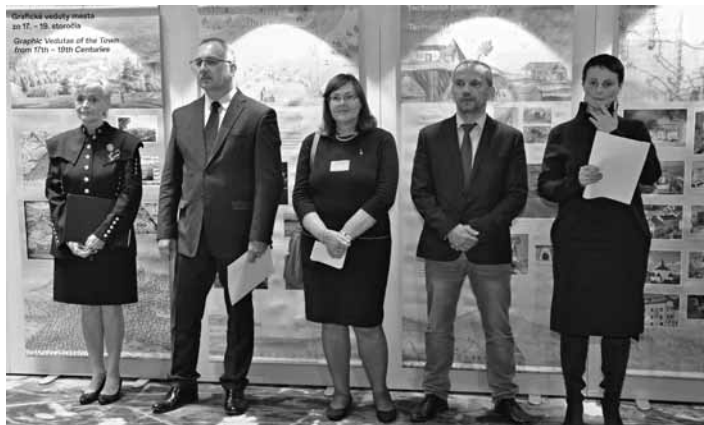
Vernisáž výstavy v Európskom parlamente 33.str.

Banská Štiavnica je mesto, ktoré si právom zaslúži svoje miesto v Zozname svetového dedičstva UNESCO, kde je zapísaná od roku 1993. Pri príležitosti 25. výročia zápisu sa podarilo uvedenú výstavu prezentovať na pôde Európskeho parlamentu v Štrasburgu.