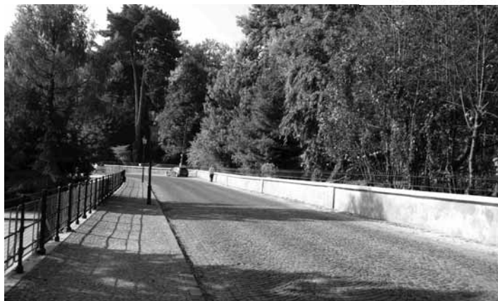
Ohradový múr botanickej záhrady na Akademickej ul.

Samotná obnova bude realizovaná v niekoľkých etapách. Najskôr budú ošetrené a doplnené kované nadstavbové časti múru a vchodových brán, potom sa pristúpi k obnove a opravám klobúka a omietkových častí, a to vyburania poškodenej omietky, vystriekania vodou, penetračného náteru muriva a novej hrubozrnnej omietky. Poslednou etapou bude doplnenie kamenného muriva kameňom vrátane vyburania špár, vystriekania vodou, penetračného náteru a vyplnenie špár.