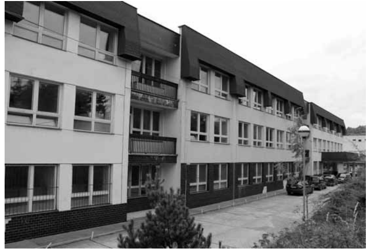
Budova Gymnázia A. Kmeťa