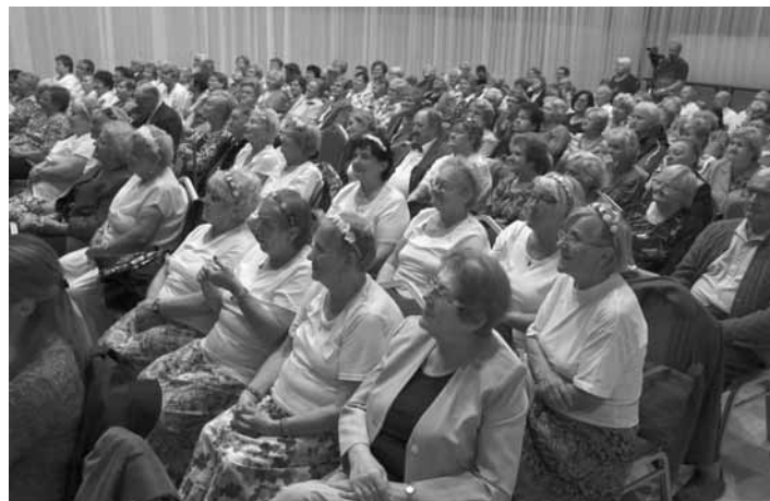
Seniori v kultúrnom centre