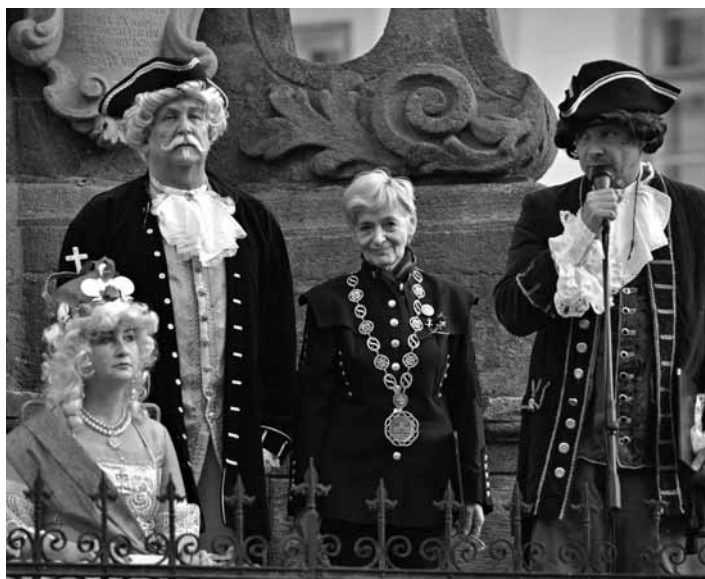
Tradície a duchovný odkaz

V piatok 12. 10. 2018 do Banskej Štiavnice zavítali akademickí funkcionári a študenti nástupníckych univerzít/fakúlt Baníckej a lesníckej akadémie, aby sa zúčastnili už 12. ročníka podujatia Akademici v Banskej Štiavnici 2018, ktorým sme si uctili tradície a duchovný odkaz tejto alma mater pre 11 nástupníckych univerzít a fakúlt, ktoré podpísali Deklaráciu pokračovateľov duchovného dedičstva slávnej Baníckej akadémie v Banskej Štiavnici.