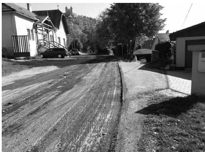
Povrchová úprava komunikácie pod Kalváriou

Mesto Banská Štiavnica začalo v 40. týždni práce na rekonštrukcii verejných priestranstiev ulice Pod Kalváriou. Dodávateľom stavebných prác je firma Colas Slovakia, a. s. Práce začnú osadením dočasného dopravného značenia, následným frézovaním komunikácie a budú pokračovať prácami kompletnej rekonštrukcie komunikácie, t. j. dažďovej kanalizácie, verejného osvetlenia a s celkovou povrchovou úpravou komunikácie. Celkový náklad re-