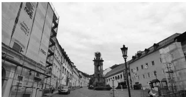
Prebiehajúce práce na Nám. sv. Trojice