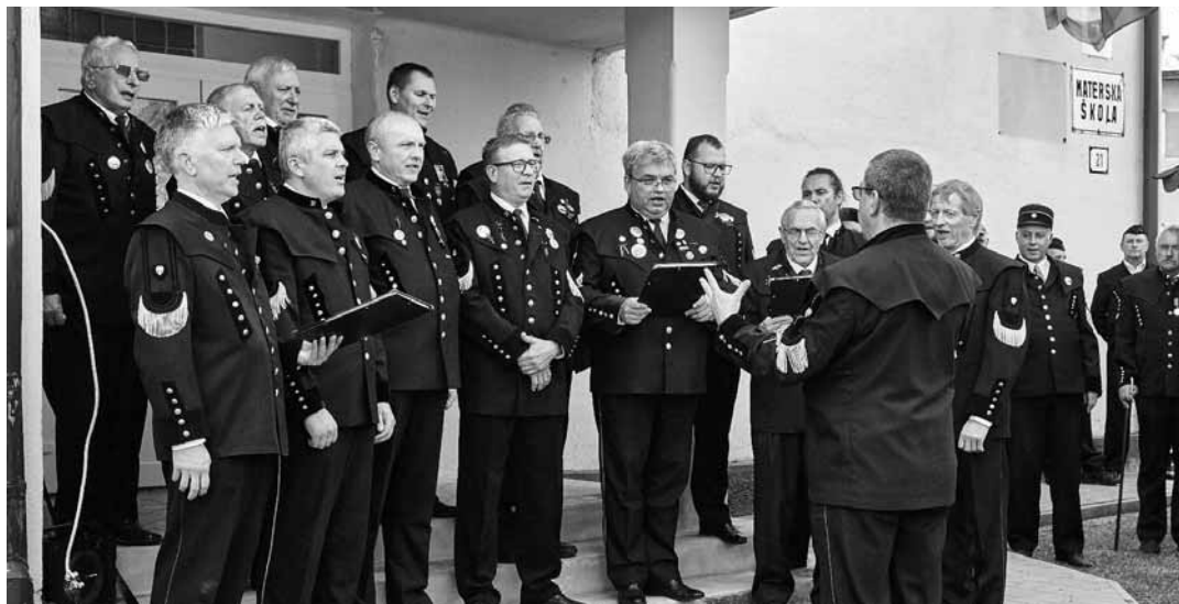
Spevokol Štiavniččan v Nižnej Slanej