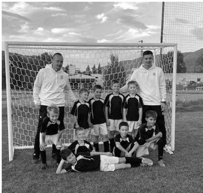
Mužstvo chlapcov U9-ka

Naša U11ka 7. 10. absolvovala ďalší úspešný zápas v sezóne, keď porazila družstvo z Lovčice-Trubín 26:6. Po zápase nechýbal víťazný pokrik. Chalani, gratulujeme a držíme vám