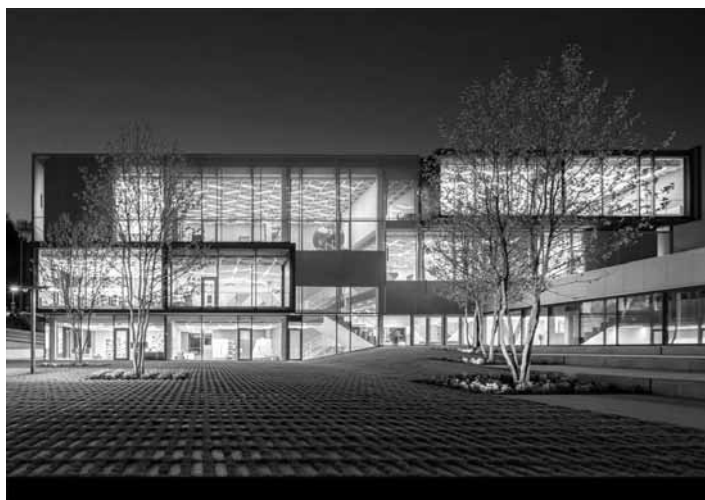
Súkromná ZŠ Guliver

Hodnotenie poroty: Objekt svojou architektonickou a dizajnerskou kvalitou, ako sa aj samotným prevedením ďaleko presahuje