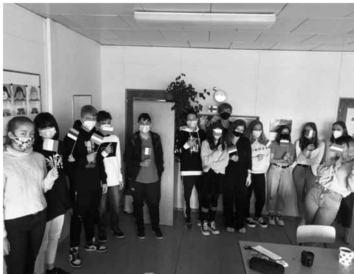
Študenti Súkromnej hotelovej akadémie

Na Súkromnej hotelovej akadémii sme si celý týždeň pripomínali význam mnohojazyčnosti v živote mladých ľudí. Snažili sme sa žiakom spestriť vyučovanie cudzích jazykov v rôznych podobách. Začali sme na nemeckine realizáciou rôznych vedomostných kvízov a hier, kde prejavili svoju tvorivosť naši prváci. Pri šálke horúceho čaju tak strávili zábavné vyučovanie, kde súťaživosť jednotlivých tímov nepoznala hraníc. Vyššie ročníky vsadili vyučovanie na hry z oblasti reálií počúvajúc nemecké hity od slávneho Karla Gotta. Hodina francúzštiny sa niesla v duchu francúzskej gastronómie. Žiaci si spolu s vyučujúcou pripravili rôzne sladké špeciality francúzskej kuchyne a zinscenovali tak v odbornej učebni pravé gurmán-