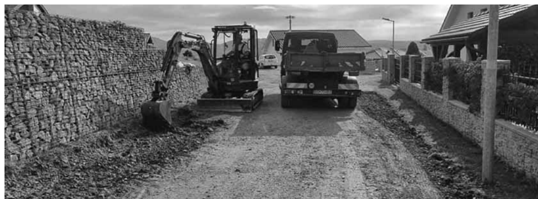
Stavebné práce na komunikácii Ul. SNP