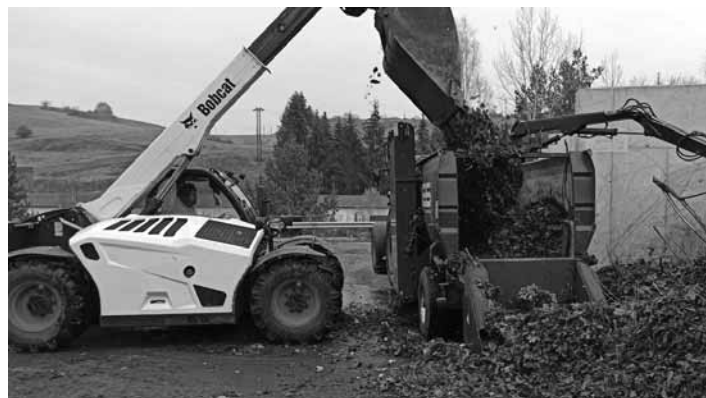
Bioodpad patrí do kompostárne

Jeseň je tu a s ňou aj čas opadaného lístia a čistenia záhradiek. V záhradách vzniká množstvo bioodpadu – nielen opadané lístie, ale aj rôzne pozberové zvyšky rastlín, burina z čistenia záhonov a pod. Všetok takýto bioodpad je pre záhradu cennou surovinou a patrí spolu s každodenným bioodpadom z kuchyne do kompostu. Pokiaľ máte v záhrade bioodpadu príliš veľa a váš domáci kompostér ho nestíha spracovať, treba takýto bioodpad priniesť na zberný dvor. Bioodpad z nehnuteľností z Banskej Štiavnice odoberáme bezplatne. Vyrobíme z neho kompost, ktorý na jar môže poslúžiť pre pohnojenie aj vašej záhradky. Mnohí nechcú kompostovať orechové lístie alebo majú lístia príliš veľa. Všetko to patrí na zberný dvor. Určite bioodpad nedávajte do nádob na zmesový komunálny od-