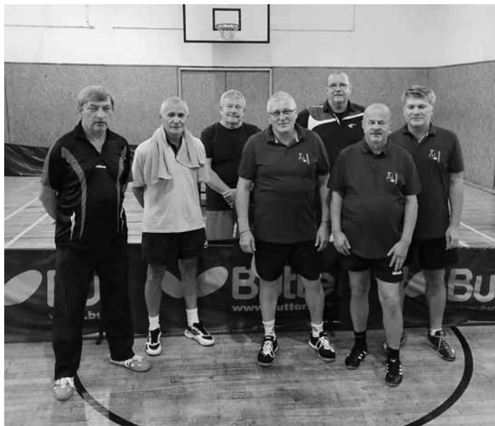
Hráči pred zápasom s Riečkou