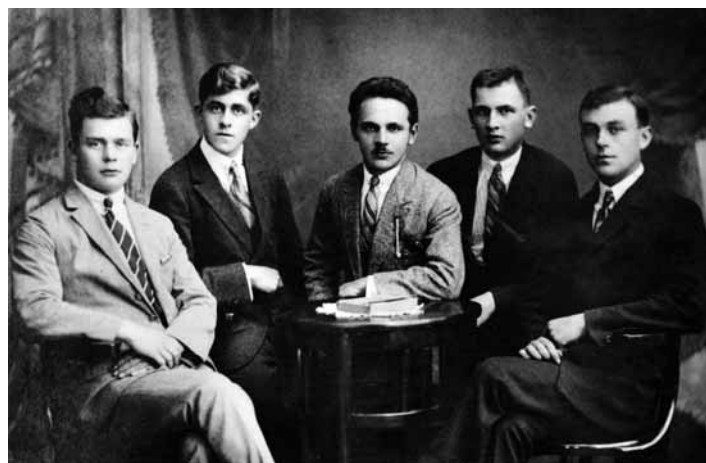
Prvých absolventov školy, IV. tr., štud. odb. hosp.-chem.