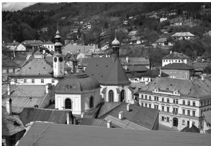
13.str. Panoráma mesta