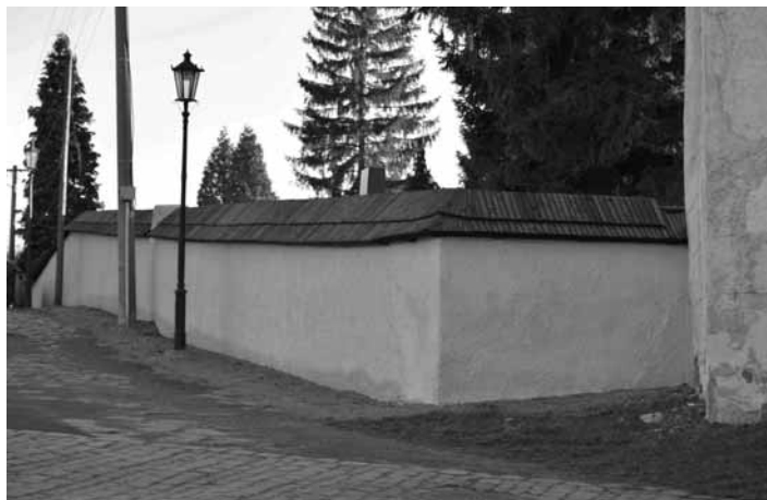
Ohradný múr pri Frauenbergskom kostole 33.str.

Ďalším úspešným projektom bola realizácia Obnovy ohradného múru – 2. etapa, ktorý je súčasťou národnej kultúrnej pamiatky „kostol Frauenbergský, rímskokatolícky Panny Márie Snežnej“ zapísaný v Ústrednom zozname pamiatkového fondu pod č. 2487/1 – 3.