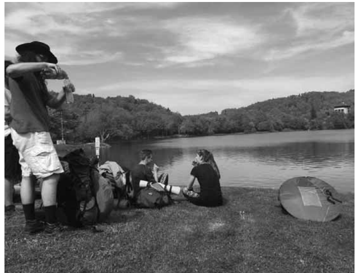
Študenti a učitelia z GYMBS na cvičnej DofE expedícii

koho starať, no vy sa zvládnete po- starať len o seba? Ja síce nie, no naše „decká“ našťastie áno! Koniec koncov, hlavným cieľom programu (aspoň v mojom ponímaní), je pre- konať samého seba a objaviť v sebe skryté a niekedy aj nevídané mož- nosti, no takisto aj pomáhať tým, ktorí to potrebujú. A presne toto sa už od minulého školského roka na našom gymnáziu darí viac než dvadsiatke žiakov zapojených do programu, a pokiaľ tento rok ne- poľavia, začiatkom budúceho škol- ského roka budú ocenení a otvoria sa im dvere ako do vyššej úrovne programu, tak aj do svetlejšej bu- dúcnosti.