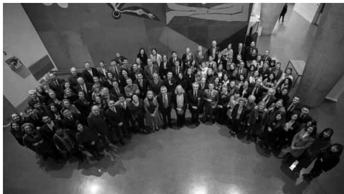
Účastníci konferencie v sídle UNESCO v Paríži

V rámci Európsko-čínskeho roka cestovného ruchu sa v sídle organizácie UNESCO v Paríži uskutočnila dňa 29. 10. 2018 konferencia na vysokej úrovni, ktorá sa týkala európsko-čínskych vzťahov na úrovni kultúry a cestovného ruchu, ako aj svetového dedičstva a udržateľného cestovného ruchu v Európe. Na konferenciu boli pozvané aj lokality UNESCO zapojené do projektu Cesty po európskych lokalitách svetového dedičstva. Konferencie sa zúčastnili predstavitelia UNESCO, Ministerstva kultúry a cestovného ruchu Čínskej ľudovej republiky, Európskej únie, Európskej komisie,