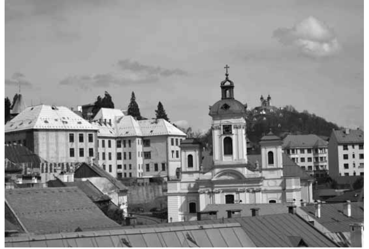
Pohľad na dominanty mesta

25.10. v Rádiu Slovensko o 18:00 okrem ministra dopravy SR o pripravovanej novelizácii stavebného zákona hovorila aj primátorka mesta. 26.10. v Rádiu Regina od 14:05 do 15:00 bola venovaná pozornost vzťahu 1. československého prezidenta T. G. Masaryka k Slovensku, aj o jeho pohyboch v Topoľčiankach a Bystrici, pričom najväčšia pozornosť bola venovaná jeho návšteve v B. Bystrici v r.1923. V tejto súvislosti však nepadlo ani len slovo, že 25.8.1923 absolvoval aj pompežnu návštevu B. Štiavnice. Z radnice išiel cez Námestie sv. Trojice do múzea v Starom zámku, odkiaľ išiel na šachtu František, na Štátnu priemyselnú chemickú školu a svoju návštevu ukončil v Botanickej záhrade. Z ďalších československých prezidentov už B. Štiavni-