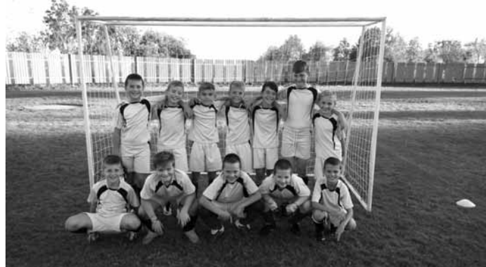
Futbalisti prípravky U 11

Do zápasu sme nastúpili s prílišným rešpektom, bez nasadenia a hneď od začiatku sme sa prispôbili súperovi. Hlavne ma mrzí, že aj starší hráči sa prispôbia, namiesto toho, aby išli futbalovým príkladom mladším chalanom. Ako som spomenul na začiatku, mladší hráči ešte len zbierajú zápasovú prax, a tak verím, že poctivým tréningom a samotnými zápasmi to bude len a len lepšie. Musíme preniesť nasadenie z tréningových jednotiek do zápasu a ne-