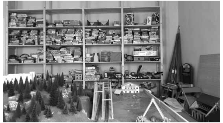
Veľká požičovňa hračiek v Terra Permonia

Jednalo sa najmä o sociálne projekty, ako napríklad výdajňa jedla na Špeciálnej základnej škole, podpora ročnej rehabilitácie pre klientov OZ Margarétka a iné. Spolok, v spolupráci s organizáciou švajčiarskych žien Kontakt, tiež dlhodobo podporuje Domov na polceste v Banskom Studenci. Tentoraz však v našom meste vzniká projekt pre inú cieľovú skupinu – rodiny s deťmi. Na základe iniciatívy Spolku, bola v Hunenbergu zrealizovaná veľká zbierka hračiek. Vytvoril sa tak pevný základ projektu – ZáHRAJda. Jedná sa o novú inovatívnu požičovňu hračiek, ktorá v sebe spája viacero myšlienok. Projekt má environmentálny cha-