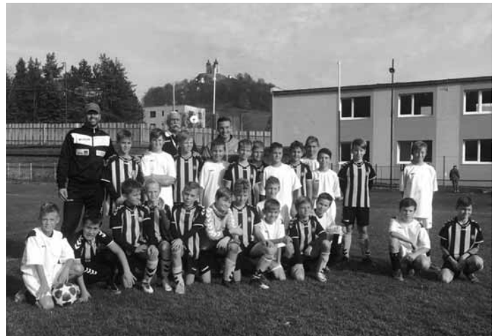
Prípravka s futbalistami FK Inter Bratislava

Do zápasu sme vstúpili bez rešpektu, s patričným nasadením, s cieľom prekvapiť a pobiť sa o čo najlepší výsledok, ale hlavne zahrať si futbal. Do polovice prvého polčasu sa nám to aj darilo, so súperom sme držali krok individuálne, aj kombinačne.