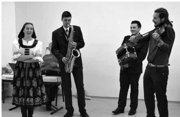
Členovia hudobného krúžku