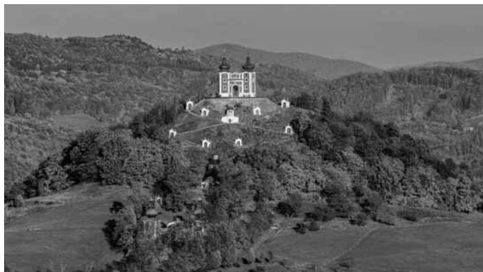
Pohľad na Kalváriu

Cena Slovenskej republiky za krajinu je čestným vyznamenaním pre organizácie, ktoré ideovo, tematicky prispievajú k implementácii Európskeho dohovoru