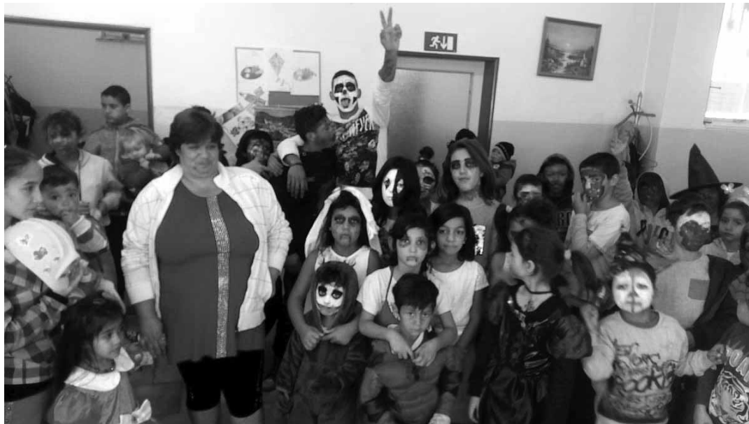
Deti z komunitného centra v maskách