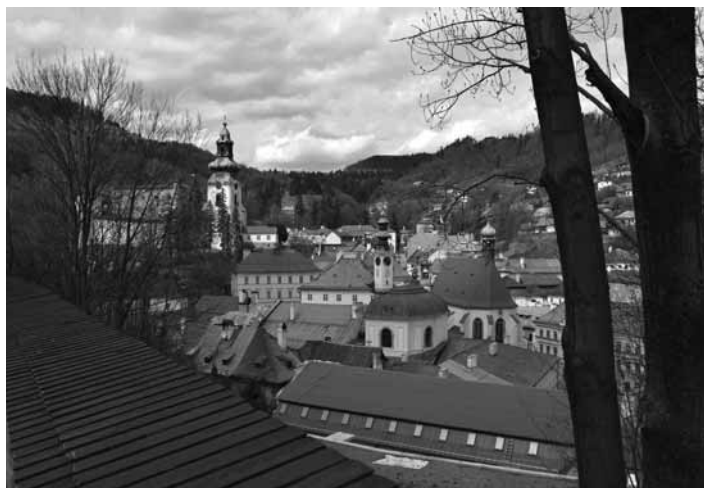
Panoráma mesta

Volebné miestnosti sa otvorili o 7:00 hod. a voliči mohli voliť do 22:00 hod. Občania nášho mesta si volili ich volených zástupcov na post primátora mesta (1 z 3 kandidátov) a poslancov MsZ (13 z 39 kandidátov – I. obvod 19 kandidátov, II. obvod 16 kandidátov a III. obvod 4 kandidáti).